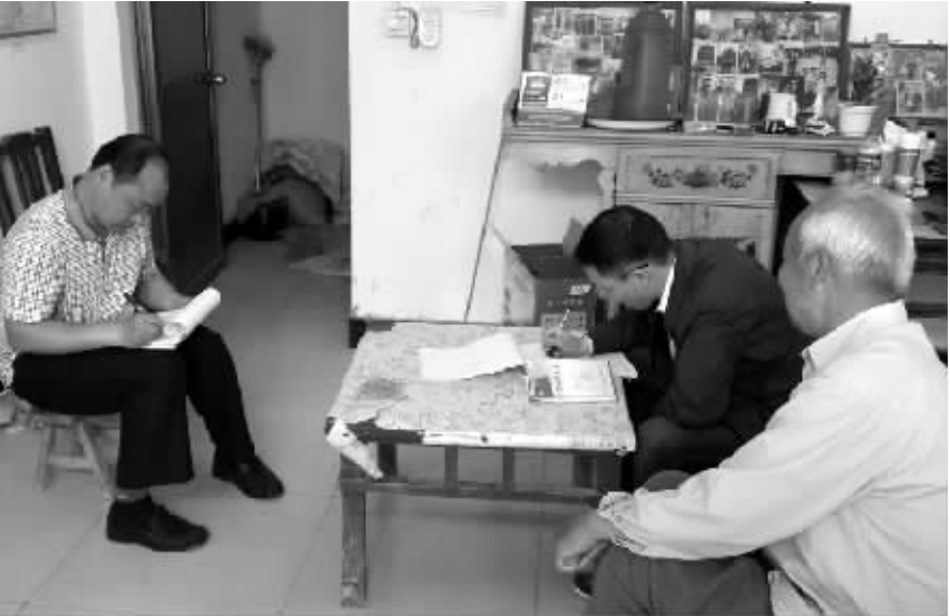
和农民拉家常，把法律咨询送进庭院。