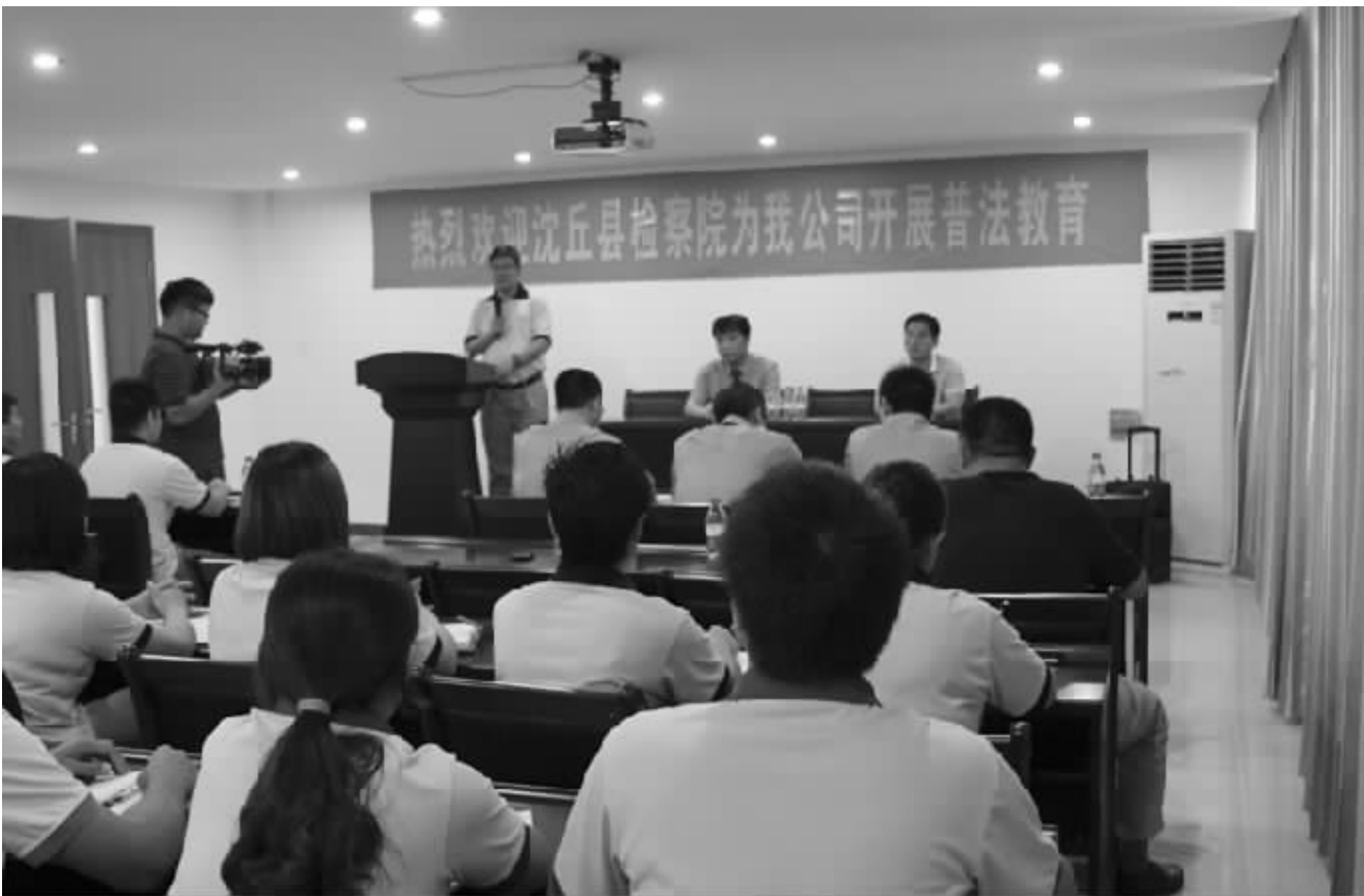
检察长周威亲自到企业上法制课，朴实的语言、寓教于乐的形式、精彩的演讲博得阵阵掌声，为员工心灵进行一次全面洗礼。

畅通农村法制宣传渠道，助力平安建设。该院加强与乡镇党政部门的联系配合，结合平安创建活动，检察干警走村串户，进田间、入庭院，向广大群众宣传与生产生活密切相关的《土地法》、《婚姻法》等法律法规，认真摸排各乡镇、村民矛盾纠纷线索，了解民情动态，掌握社会治安状况，宣传检察职能，发放宣传资料，征求对检察工作的意见和建议。该院把化解矛盾纠纷的过程作为宣讲法律的过程、作为消除不安定因素的过程，积极化解矛盾纠纷，以案说法，检察院共调处矛盾纠纷 57 件，先后向群众集中宣传法律知识 60 多场次，将预防职务犯罪工作向农村延伸，召开由村镇干部参加的专项职务犯罪预防大会，宣讲近几年来外地发生的涉农职务犯罪动态、特点，组织参会人员谈感受、讲体会、表决心，强化预防效果。一方面引导农村基层组织工作人员廉洁奉公、勤政为民，推进农村反腐倡廉建设，另一方面引导群众遵纪守法，理性解决邻里矛盾纠纷，注重学习防盗防骗知识，学会运用法律武器保护自身合法权益。按照县委“千人驻村大走访服务群众”活动，该院组织干警走访 5000 余户群众，发放填写入户调查表 5000 余份，发