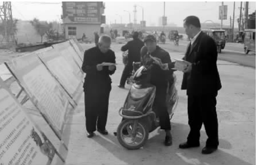
展览图文并茂，助推社区居民普法热。