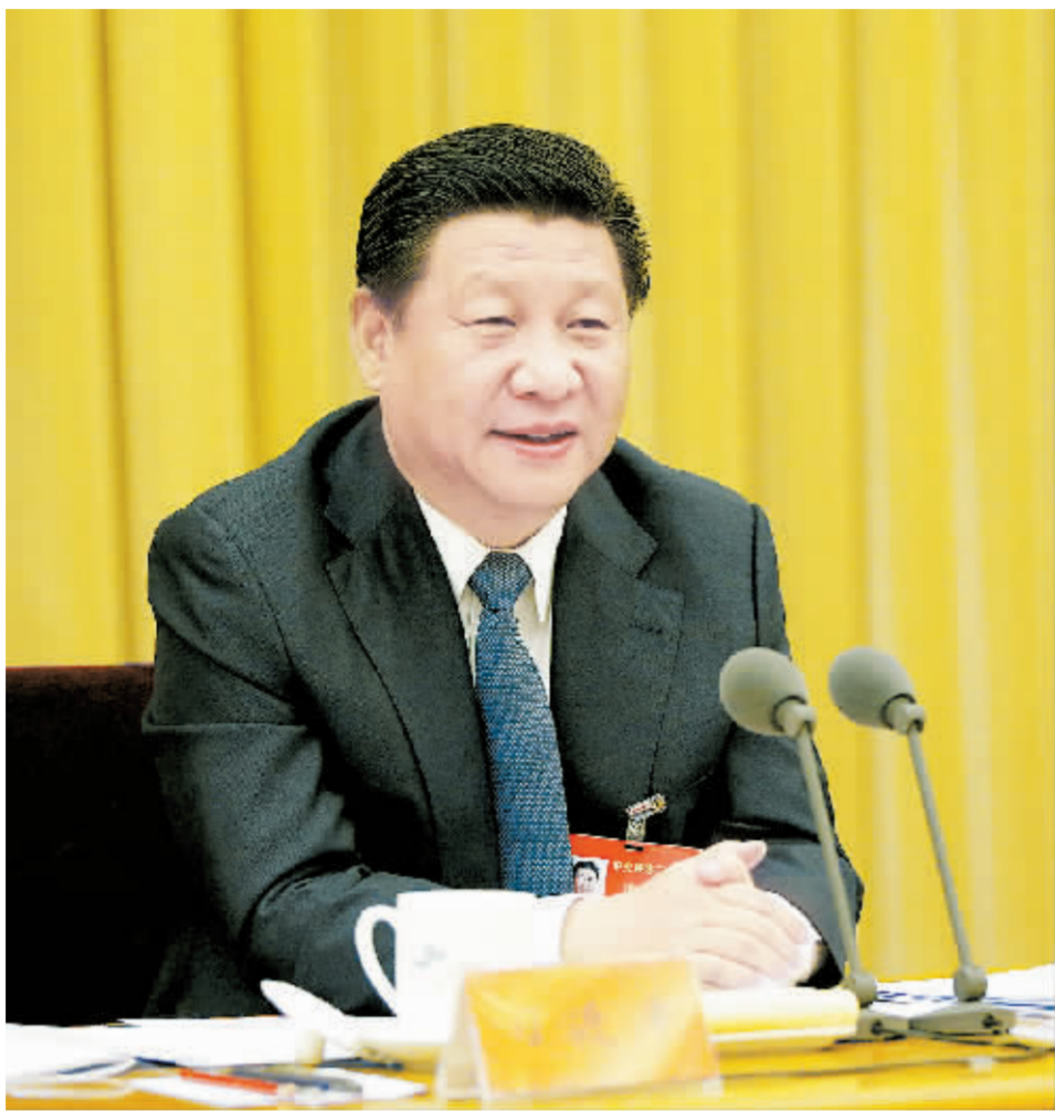
12月9日至11日,中央经济工作会议在北京举行。中共中央总书记、国家主席、中央军委主席习近平发表重要讲话。