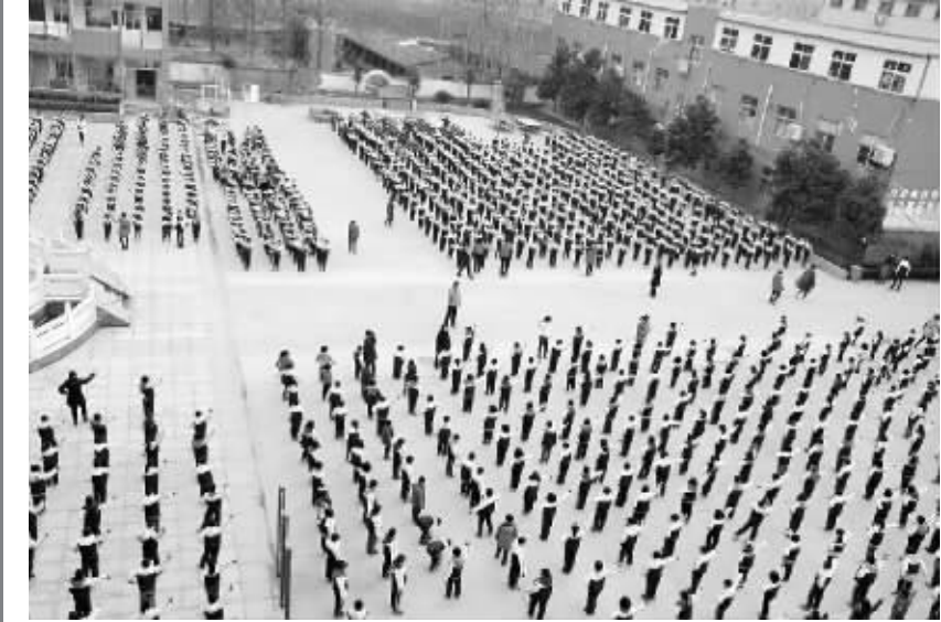
近日，周口新星学校筹集资金，为全校 3900 余名学生量身定做校服并免费发放给学生，此举受到了学生和家长的的一致好评。图为该校小学段学生身着校服表演课间操《小苹果》。