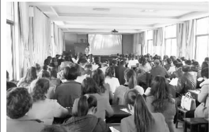
项城市工业路小学积极开展教研教改活动，强力推进新课程改革，积极打造高效课堂。学校定期召开教师例会，不定期组织教师进行校本培训，努力提高教师教学业务水平。图为该校教师进行教学经验交流。