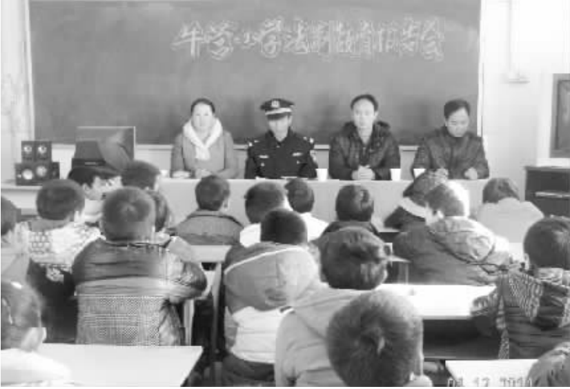
近日，周口市牛营小学邀请周口市公安局七一分局警官作法制教育报告。报告中，警官结合学生实际，以案释法、依法论事，形象生动地讲解了预防青少年犯罪、安全保护等方面的法律知识，此次活动达到了预期的教育效果。