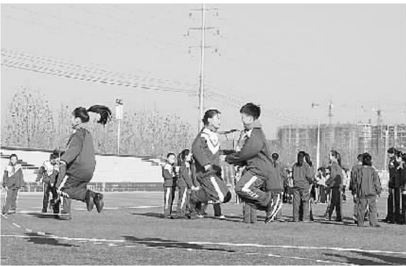
近日，冬阳闪耀的郸城一高新校区，欢快悠扬的课间操音乐声响彻操场，统一着装的参赛队伍一展青春的风采，矫健的身影定格在赛场上，掌声、叫好声、加油声如浪如潮，振奋人心。郸城县首届中小学体育大课间比赛总决赛在这里举行。