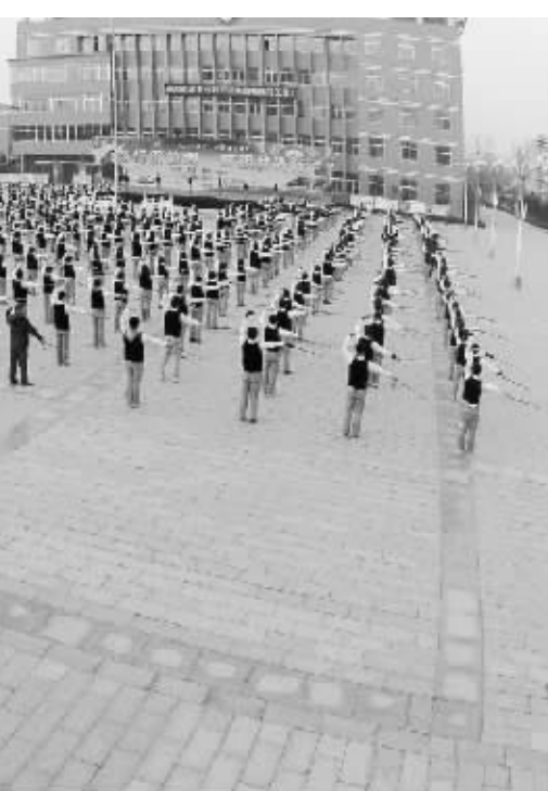
12 月 12 日，周口市文昌中学接受中心城区义务教育阶段学校大课间评比活动小组的检阅。当日，伴随着该校下午大课间活动开始的悦耳铃声，4000 多名学生整齐有序地从教学楼鱼贯而出，朝各班划定的活动区域走去。随后，“两操”活动相继开始，师生共同投入到丰富多彩的大课间活动中，校园里一片欢腾。

对症下药才有疗效。针对培训市场的混乱，需要明确标准、提高门槛，把敛财者挡在门外；针对多头管理弊端，亟须在制度上明确分类和监管责任，真正把各类机构都管起来，并建立部门联动机制；针对资金风险，需要完善监督保障制度，建立包括信息披露、风险防控和预警、紧急干预等全方位的制度安排，才能杜绝培训机构将不属于它的钱卷走，才能让望子成龙、望女成凤的家人们安心走入培训机构的大门。