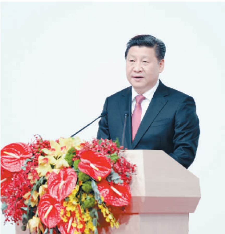
12 月 20 日,庆祝澳门回归祖国 15 周年大会暨澳门特别行政区第四届政府就职典礼在澳门东亚运动会体育馆隆重举行。中共中央总书记、国家主席、中央军委主席习近平出席并发表重要讲话。

习近平指出,澳门回归祖国 15 年来,“一国两制”实践取得了丰硕成果。“一国两制”、“澳人治澳”、高度自治方针和澳门特别行政区基本法在澳门社会广泛深入人心、得到切实贯彻落实,宪法和基本法规定的澳门特别行政区宪制秩序