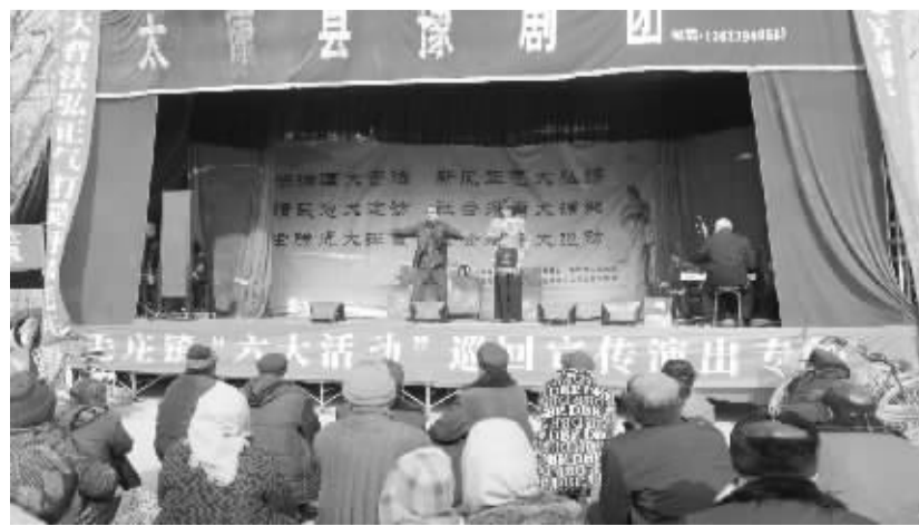
毛庄镇以“七访七问”为抓手,深入推进“六大活动”,为更好地做好宣传,该镇举办以戏剧为主要内容的巡回演出。因为毛庄镇在县人民广场举行平安建设巡回演出。