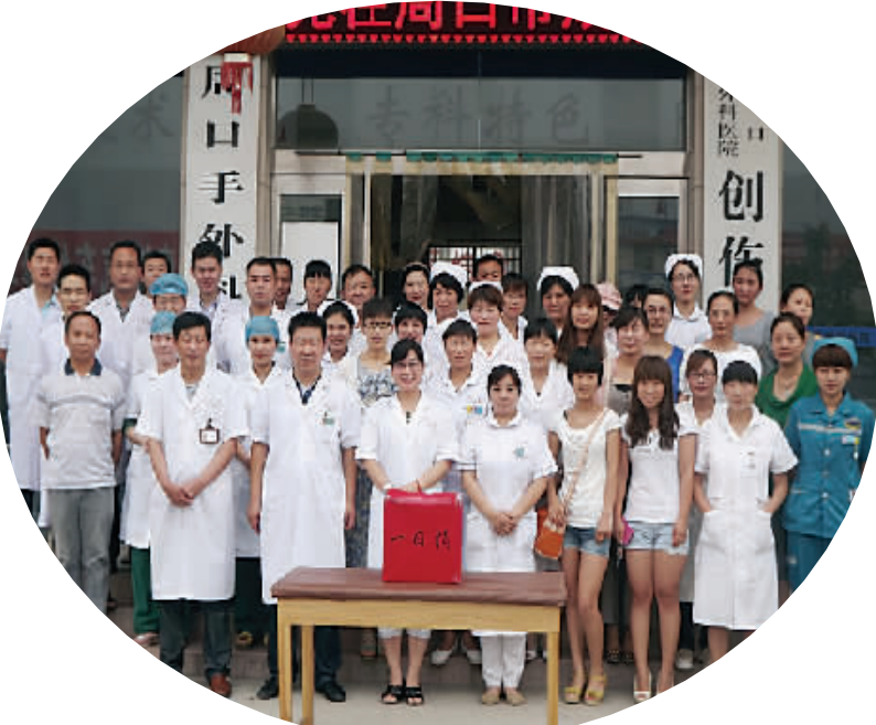
5·12汶川地震,全体员工踊跃募捐