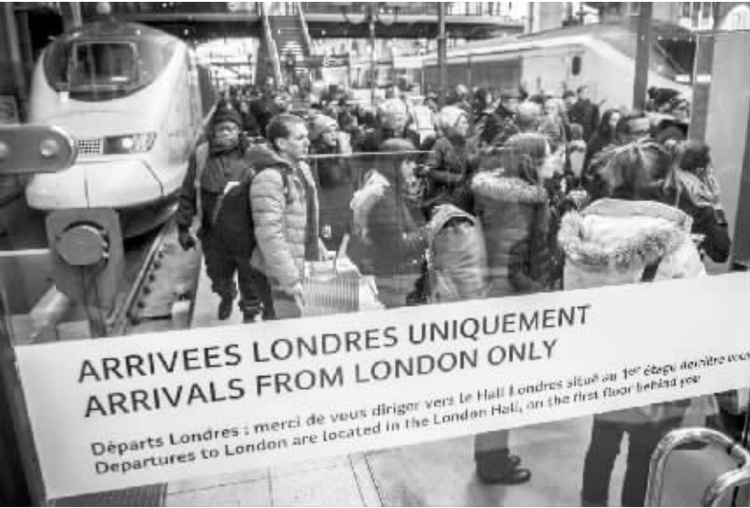
1 月 17 日，在巴黎北站，乘坐欧洲之星列车前往伦敦的乘客因隧道事故返回巴黎。

“欧洲之星”客运公司由法国、英国和比利时的国家铁路公司于 1994 年合资成立，其运营的高速铁路列车通过海底隧道跨越英吉利海峡，连接伦敦与巴黎、里尔和布鲁塞尔。