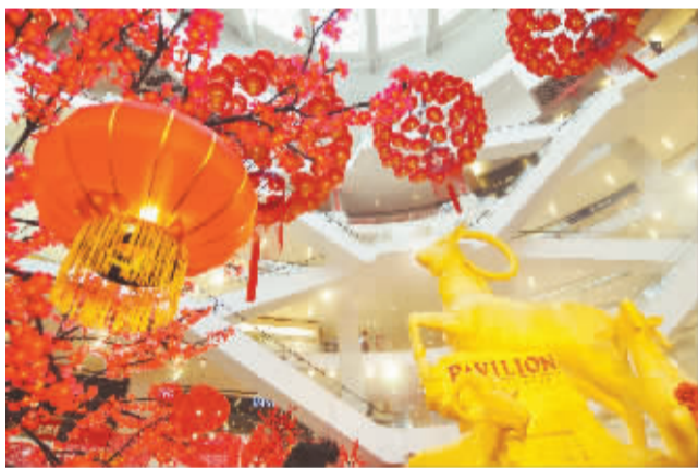
马来西亚巨型山羊塑像迎新

1月28日，游客在江苏省淮安市盱眙县第一山公园观赏雪景。近日，我国中东部迎来今年以来范围最广、持续时间最长的雨雪天气，陕西、河南、湖北、安徽等多省有暴雪。