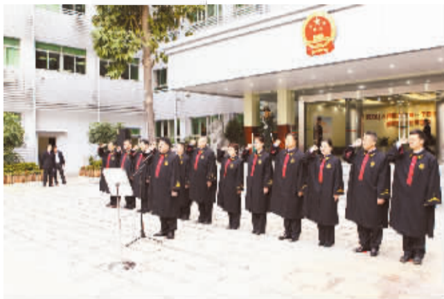
最高法第一巡回法庭在深圳挂牌

1月28日，最高人民法院第一巡回法庭法官宣誓。当日，最高人民法院第一巡回法庭在广东省深圳市挂牌，巡回区为广东、广西、海南三省区。