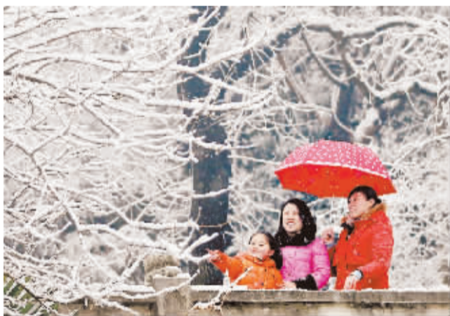
我国中东部迎来降雪

1月28日，最高人民法院第一巡回法庭法官宣誓。当日，最高人民法院第一巡回法庭在广东省深圳市挂牌，巡回区为广东、广西、海南三省区。