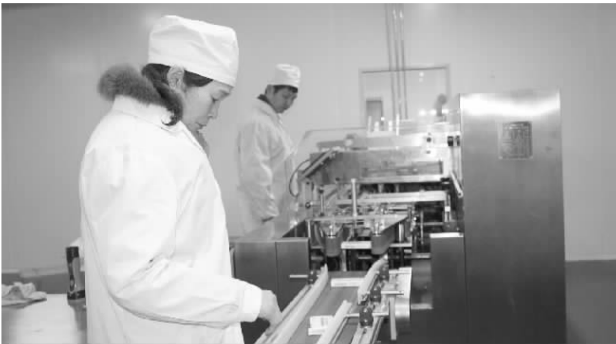
昨日,项城市某制药有限公司工人正在流水线上生产装配产品。随着项城医药产业的快速发展,该市已拥有287个医药批准文号,打造了全新的“医药城”,形成了企业盈利、政府增收、工人就业的三方共赢局面。