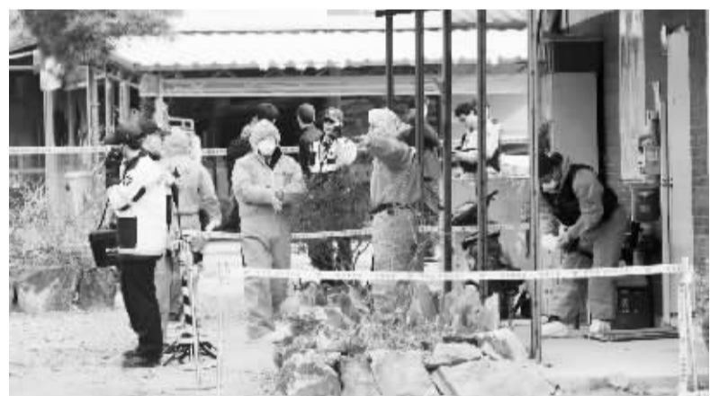
韩国世宗市发生枪击案 2月25日,在韩国世宗市,警方在枪击案现场调查。韩国警方称,世宗市一家便利店当日发生一起枪击案,造成三人死亡。枪手纵火后逃离现场。

动一阵风。节后的工作状态,是对作风建设的检验。能否迅速进入工作状态,想民之所想,急民之所急,切实落实2015年各项工作,认真研究解决实际问题,将是新一年工作成败的关键。 节后收心,从我做起,更要用心,从现在开始做起。只有这样,才能抓好做好各方面的工作,才能巩固改革发展良好势头,才能再接再厉、趁热打铁、乘势而上,推动全面深化改革不断取得新成就。(新华社昆明2月24日电)