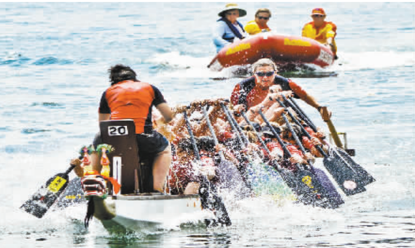
悉尼举办龙舟赛庆祝中国农历新年。2 月 28 日,在澳大利亚悉尼达令港,一支龙舟队参加比赛。

化等领域的妇女领袖、行业精英和代表 27 日聚首智利首都圣地亚哥,出席由联合国妇女署组织召开的世界女性领袖高层会议。联合国秘书长潘基文在会上呼吁,要让妇女获得更多参政机会和决策权。