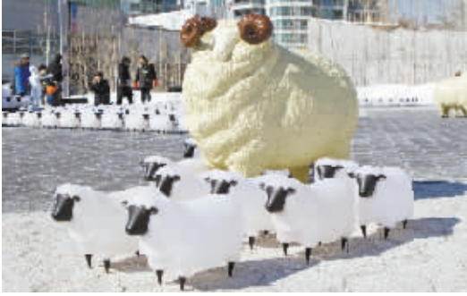
迎羊年 这是 2 月 28 日在加拿大多伦多湖滨中心拍摄的由数百只羊型灯组成的“迷你羊世界”展览。当日,加拿大多伦多湖滨中心推出彩绘羊展、彩灯羊迷宫、“迷你羊世界”等众多与羊有关的精彩活动,与游人共庆农历羊年春节。