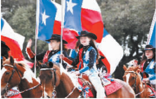
休斯敦举行牛仔节游行 2 月 28 日,在美国休斯敦,女牛仔手执德州州旗参加牛仔节游行。当日,第 79 届休斯敦牛仔节游行在美国得克萨斯州休斯敦市举行,为期三天的 2015 年休斯敦牛仔节拉开序幕。