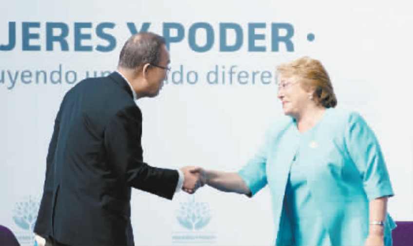
潘基文呼吁让妇女获得更多参政机会和决策权。2 月 27 日,在智利首都圣地亚哥,联合国秘书长潘基文(左)在世界女性领袖高层会议开幕式上与智利总统巴切莱特握手。来自 60 多个国家的政治、经济、文

涅姆佐夫当地时间 2 月 27 日晚在莫斯科市中心遭身份不明人员枪击身亡。俄罗斯调查委员会已经确认这一消息并展开刑事调查。