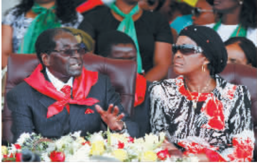
穆加贝庆祝 91 岁生日 2 月 28 日,在津巴布韦瀑布城,津总统穆加贝(左)与夫人格蕾丝在他的 91 岁生日庆典上交谈。生于 1924 年 2 月 21 日的穆加贝是津巴布韦开国元勋,自津巴布韦 1980 年独立以来先后担任总理、总统职位至今。