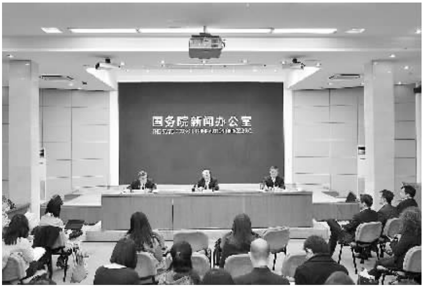
国新办举行社保基金助力发展和存款保险制度等政策例行吹风会 4 月 3 日,国务院新闻办公室举行国务院政策例行吹风会,请财政部副部长王保安、人民银行副行长潘功胜介绍促进社保基金保值增值为经济社会发展助力和存款保险制度建设有关情况,并答记者问。

诉书指控:被告人周永康在担任中国石油天然气总公司副总经理,中共四川省委副书记,中共中央政治局委员、公安部部长、国务委员和中共中央政治局常委、中央政法委书记等职务期间,利用职务上的便利,为他人谋取利益,非法收受他人巨额财物;滥用职权,致使公共财产、国家和人民利益遭受重大损失,社会影响恶劣,情节特别严重;违反保守国家秘密法的规定,故意泄露国家秘密,情节特别严重,依法应当以受贿罪、滥用职权罪、故意泄露国家秘密罪追究其刑事责任。