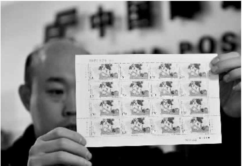
《中国古代文学家(四)》纪念邮票 4 月 4 日发行 4 月 3 日,山东省济南市集邮公司员工在展示《中国古代文学家(四)》纪念邮票。中国邮政将于 4 月 4 日发行《中国古代文学家(四)》邮票 1 套 6 枚,全套邮票面值为 7.2 元,内容分别为:汤显祖、冯梦龙、蒲松龄、洪昇、孔尚任及曹雪芹,表现了明清文学的 6 位领军人物。

办法还明确,电力企业发生电力安全事件后,如有迟报、漏报、谎报、瞒报电力安全事件信息,或不及时组织应急处置,或未按规定对电力安全事件进行调查处理,国家能源局及其派出机构可以责令限期改正,逾期不改正的应当将其列入安全生产不良信用记录和安全生产诚信“黑名单”,并处以 1 万元以下的罚款。