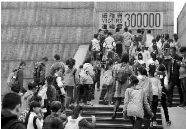
清明前夕悼念南京大屠杀遇难同胞 4 月 3 日,学生们在侵华日军南京大屠杀遇难同胞纪念馆参观。清明前夕,许多南京市民、学生、部队官兵和外地游客来到南京大屠杀遇难同胞纪念馆,缅怀历史,悼念遇难同胞。

天津市民俗专家由国庆表示,清明既有慎终追远的感伤情怀,也有欢乐赏春的喜庆气氛,因此,清明不仅仅是单纯的祭祖和扫墓,它还有踏青、荡秋千、打马球、拔河、斗鸡、蹴鞠、扑蝶、插柳等一系列风俗活动。