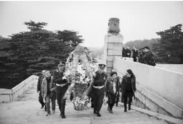
百余烈士亲属祭扫南京雨花台烈士陵园 4 月 3 日,100 多名来自北京、江苏、安徽、浙江等地的烈士亲属来到南京雨花台烈士陵园,为亲人献上花圈,表达哀思。