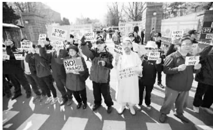
韩国民众抗议美国防长访韩及部署“萨德”导弹防御系统 4月10日,在韩国首尔,民众在国防部门前抗议。当日,民间团体在韩国国防部门前抗议美国防部长阿什顿·卡特访问并强烈反对在韩部署“萨德”导弹防御系统。阿什顿·卡特于当日下午抵达韩国,进行为期三天的访问。

对于各地有关再生的具体政策不一致问题,宋树立说,党的十八届三中全会以来,各地根据中共中央、国务院关于调整完善生育政策的意见和全国人大常委会关于调整完善生育政策的决议,结合本地实际情况,通过修订地方性法规或作出专门规定,依法启动实施单独二孩政策。这是根据各地特点,各地人口形势、人口结构作出了相应的再生的条件规定,这样做符合人口与计划生育法的授权,也符合中央精神。