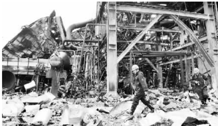
福建省事故调查组进入火场对事故原因进行调查 4月10日,专家调查组在火场调查取样。当日,福建省事故调查组进入漳州古雷腾龙芳烃二甲苯装置漏油着火事故现场对事故原因进行调查。4月6日18点56分,漳州古雷的腾龙芳烃二甲苯装置发生漏油着火事故,引发装置附近中间罐区三个储罐爆裂燃烧,经过复燃、扑灭、再复燃,并引发新的罐体爆燃的火情反复,于9日凌晨2点57分被扑灭。

据测算,在3月份-4.6%的全国工业生产者出厂价格指数环比降幅中,去年价格变动的翘尾因素约为-2.7个百分点,新涨价因素约为-1.9个百分点。