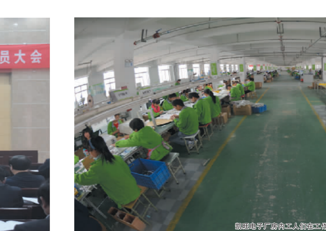
凯旺电子厂外贸工人在工作

6.27亿元，从业人数达4.6万人，五项指标均居全市第一位。投资1.65亿元的10条集聚区道路、4座桥梁已完成70%工程量，集聚区框架进一步拉大，承载能力显著增强。日前，在全省召开的产业集聚区工作会议上，沈丘县产业集聚区再获殊荣——连续四年被评为全省先进产业集聚区，晋升为二级产业集聚区。 全年粮食生产87.8万吨，连续11年增产增收。“百千万”工程建顺利，整合涉农项目资金1.6亿元，完成6个“万亩方”，13.7万亩高标准粮田建设任务，粮食生产能力持续提升。新型农业经营主体进一步夯实，全面完成农村集体土地所有权确权登记发证工作，顺利完成农村土地承包经营权确权登记颁证试点工作，市级以上农业产业化龙头企业达32家，百亩以上规模流转土地35万亩，注册农民专业合作社1532个，林家富种植专业合作社荣获国家级示范社。农业生产条件进一步改善，投资1.6亿元，建设完成小农水重点县项目、农村安全饮水等水利工程；落实农机购置补贴资金1753万元，新增大型农机722台(套)，农业结构进一步优化，肉牛、肉羊养殖快速发展，规模养殖场建设总数、标准均居全市第一位；投入1000多万元，完成1.2万亩植树造林，任务完成率居全市第一位。 城乡统筹发展迅速。坚持规划先行，完成产业集聚区、商务中心区空间规划、控制性详细规划，编制完成全县道路系统、供水系统专项规划。加快基础设施建设，颍河大道中段、吉祥路西段、新华街南段续修工程全部完工，省道102东环路至纸店建成通车，洪山—北杨集、付井—冯营集乡道施工顺利，省道207大修工程、沈鄆快速通道前期工作有序推进，漯阜铁路全线开通，宁洛高速公路收费站正式运营，投资1250万元改造完成40条小巷，北城小康幸福农副产品综合批发市场建成开放，沙河大闸水利发电站即将并网发电，天然气、自来水、通讯电力、污水管网等基础设施进一步完善。坚持建管并重，县财政增加投入500多万元，实施城区环卫体制改革，开展三轮车整治，新开通9路10路城区公交线路，全县公交车达200辆，初步缓解城乡拥堵问题。开展“两进”治理专项行动，排查摸底工作顺利完成，“两进”行为得到有效遏制，加快小城镇建设，老城镇被评为省级生态镇，大邢庄乡、周营乡乡级镇工作有序推进。县城建成区面积达29平方公里，常住人口30万人，城镇化率预计达到33.74%，新型城镇化“一发动全身”效应进一步显现。