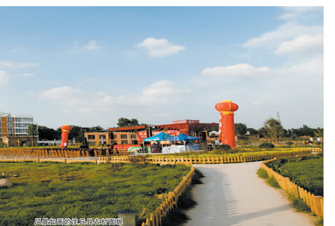
风景如画的沈丘县农村街景