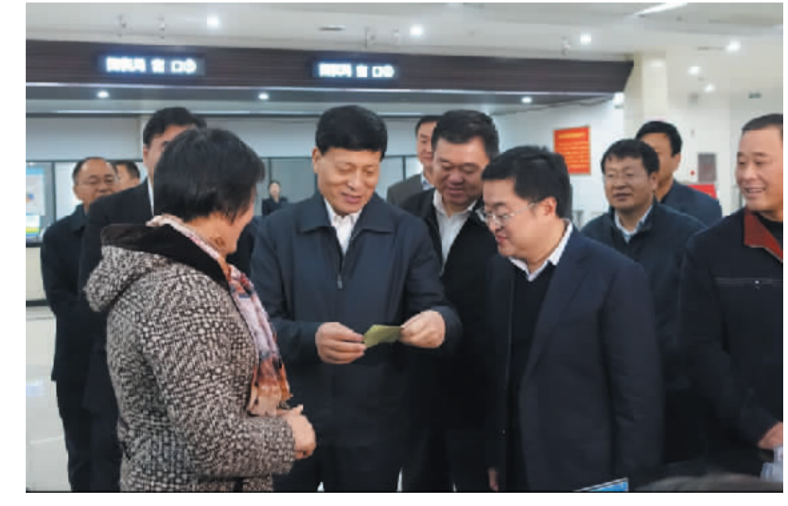
省长谢伏瞻在沈丘行政服务中心调研