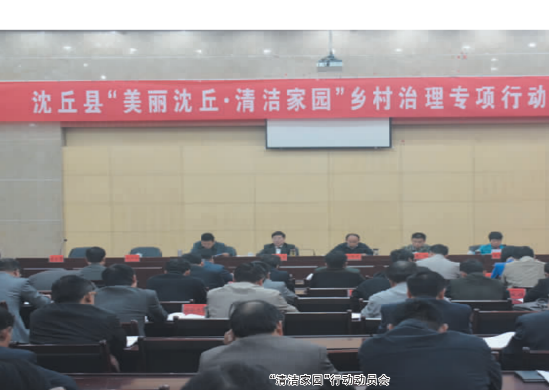
“清洁家园”行动动员会

6.27亿元，从业人数达4.6万人，五项指标均居全市第一位。投资1.65亿元的10条集聚区道路、4座桥梁已完成70%工程量，集聚区框架进一步拉大，承载能力显著增强。日前，在全省召开的产业集聚区工作会议上，沈丘县产业集聚区再获殊荣——连续四年被评为全省先进产业集聚区，晋升为二级产业集聚区。 全年粮食生产87.8万吨，连续11年增产增收。“百千万”工程建顺利，整合涉农项目资金1.6亿元，完成6个“万亩方”，13.7万亩高标准粮田建设任务，粮食生产能力持续提升。新型农业经营主体进一步夯实，全面完成农村集体土地所有权确权登记发证工作，顺利完成农村土地承包经营权确权登记颁证试点工作，市级以上农业产业化龙头企业达32家，百亩以上规模流转土地35万亩，注册农民专业合作社1532个，林家富种植专业合作社荣获国家级示范社。农业生产条件进一步改善，投资1.6亿元，建设完成小农水重点县项目、农村安全饮水等水利工程；落实农机购置补贴资金1753万元，新增大型农机722台(套)，农业结构进一步优化，肉牛、肉羊养殖快速发展，规模养殖场建设总数、标准均居全市第一位；投入1000多万元，完成1.2万亩植树造林，任务完成率居全市第一位。 城乡统筹发展迅速。坚持规划先行，完成产业集聚区、商务中心区空间规划、控制性详细规划，编制完成全县道路系统、供水系统专项规划。加快基础设施建设，颍河大道中段、吉祥路西段、新华街南段续修工程全部完工，省道102东环路至纸店建成通车，洪山—北杨集、付井—冯营集乡道施工顺利，省道207大修工程、沈鄆快速通道前期工作有序推进，漯阜铁路全线开通，宁洛高速公路收费站正式运营，投资1250万元改造完成40条小巷，北城小康幸福农副产品综合批发市场建成开放，沙河大闸水利发电站即将并网发电，天然气、自来水、通讯电力、污水管网等基础设施进一步完善。坚持建管并重，县财政增加投入500多万元，实施城区环卫体制改革，开展三轮车整治，新开通9路10路城区公交线路，全县公交车达200辆，初步缓解城乡拥堵问题。开展“两进”治理专项行动，排查摸底工作顺利完成，“两进”行为得到有效遏制，加快小城镇建设，老城镇被评为省级生态镇，大邢庄乡、周营乡乡级镇工作有序推进。县城建成区面积达29平方公里，常住人口30万人，城镇化率预计达到33.74%，新型城镇化“一发动全身”效应进一步显现。