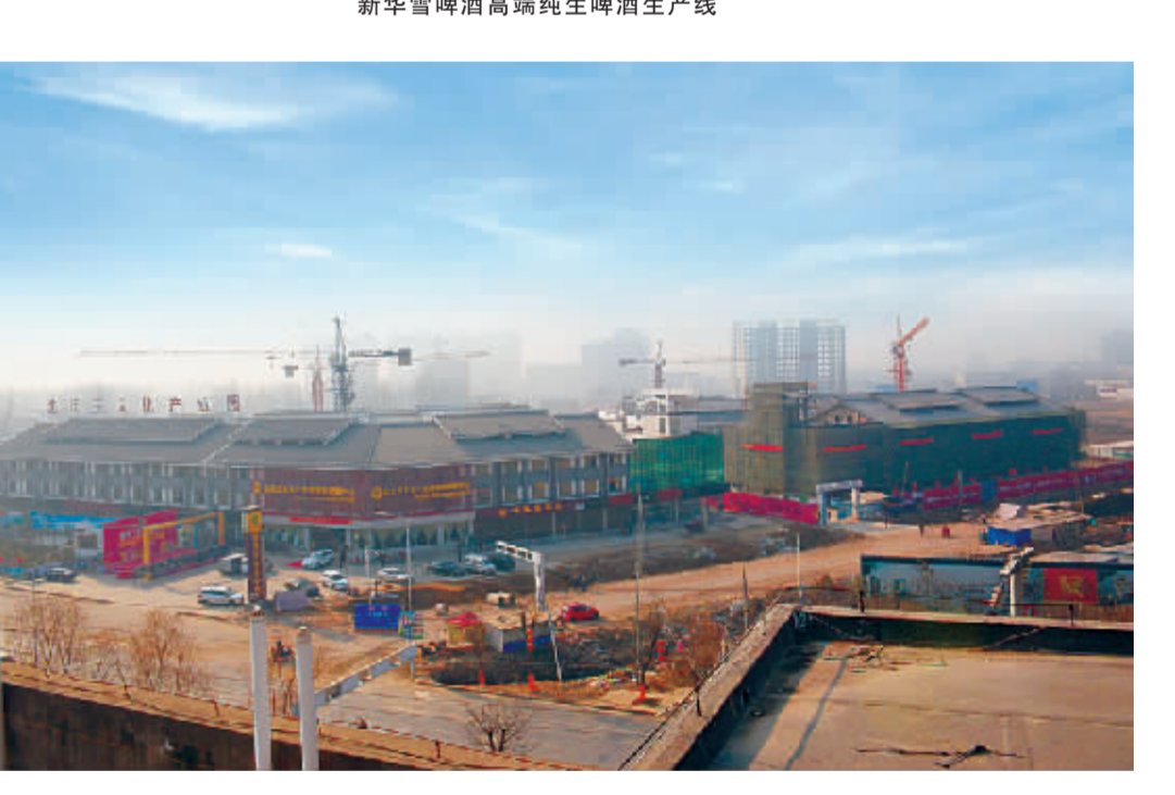
建设中的沈丘县玉文化产业园