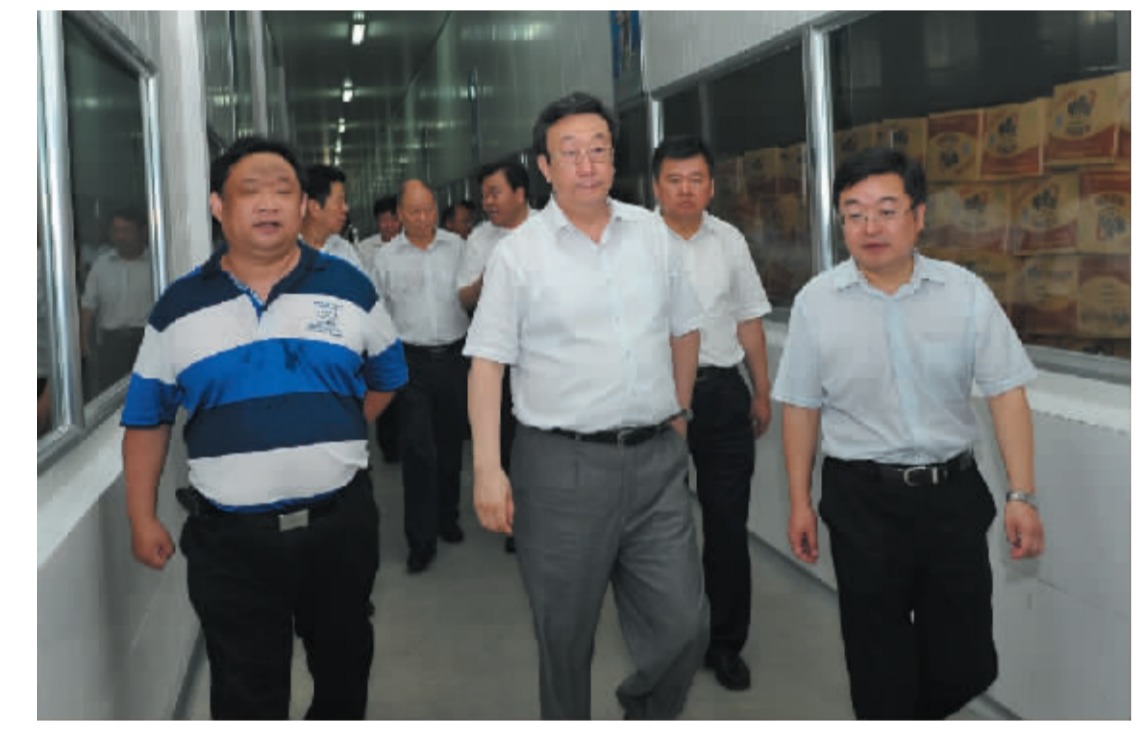
省委书记郭庚茂在金丝猴集团调研