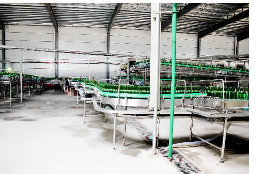
新华啤酒高端纯生啤酒生产线