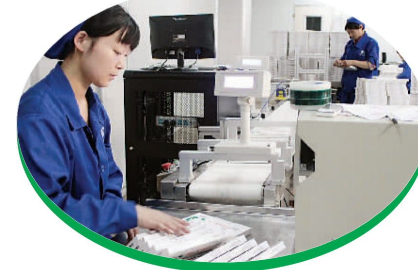
人福百年康鑫药业中药制剂生产车间