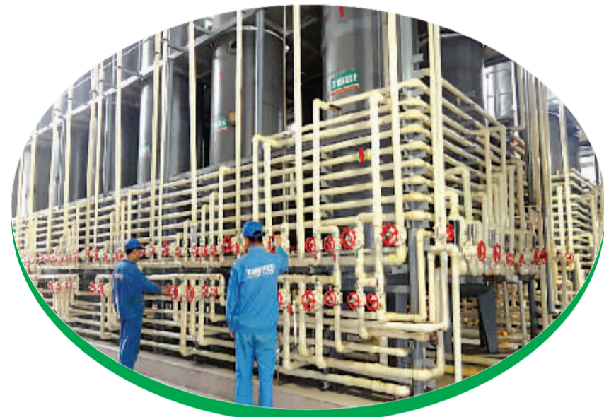
国家级农业产业化龙头企业财鑫集团液糖灌装厂区