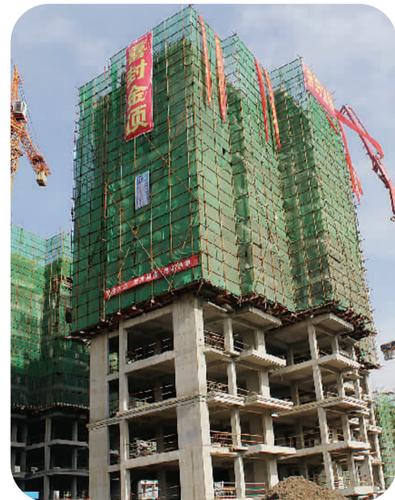
正在建设的教育社区