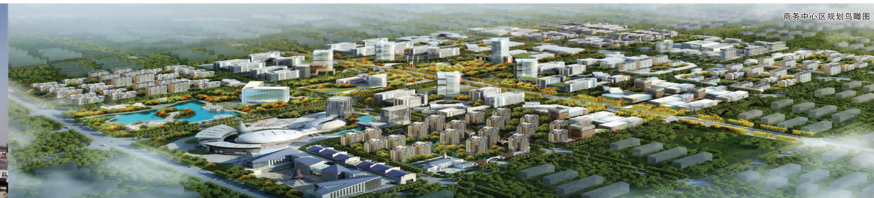
商务中心区规划鸟瞰图