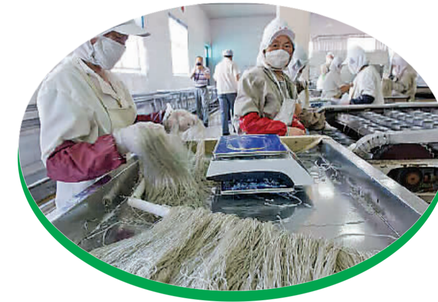
天豫薯业纯绿色食品畅销海内外