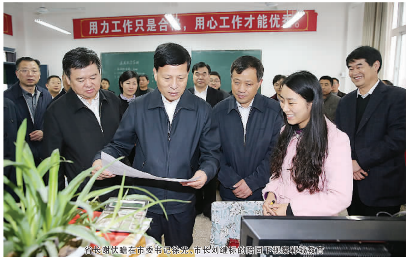
省长谢伏瞻在市委书记徐俊、市长刘建标陪同下视察郸城教育

核心提示 过去的一年,在市委、市政府的正确领导下,郸城县委、县政府以党的十八大和十八届三中、四中全会精神以及习近平总书记系列重要讲话精神为指导,紧紧围绕“富民强县、全面建成小康社会”宏伟目标,牢固树立“逢先必争、逢奖必争、勇创一流”工作精神,主动适应经济发展新常态,聚精会神抓党建,一心一意谋发展,齐心协力保稳定,经济社会各项事业继续保持平稳健康发展的良好态势。全县生产总值完成196.5亿元,增长8.6%;固定资产投资128.5亿元,增长18.9%;全社会消费品零售总额71.8亿元,增长12.7%;公共财政预算收入8.02亿元,增长2.4%;公共财政预算支出41亿元,增长9%;城镇居民人均可支配收入19479.8元,增长9.9%;农民人均纯收入7788元,增长11.5%。郸城县先后获得全国粮食生产先进县、科技富民强县试点县、“六五”普法中期先进县、生猪调出大县、河南省义务教育均衡发展先进县、信访工作先进县、人口和计划生育工作先进县、“十快”商务中心区和周口市工业发展先进县、招商引资先进县、项目建设先进县等荣誉。