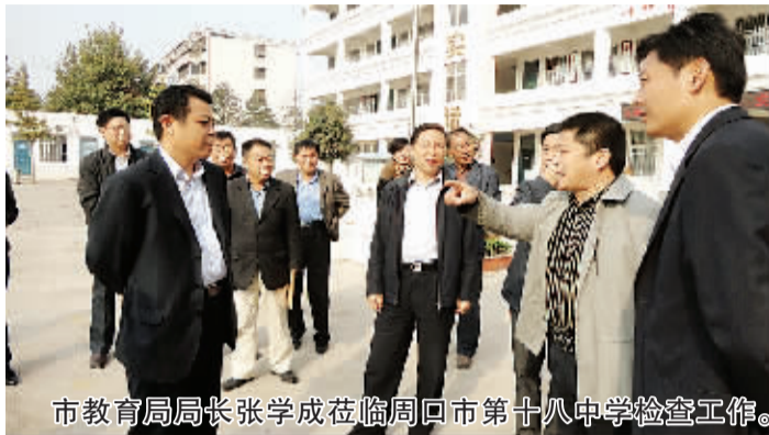
市教育局局长张学成莅临周口市第十八中学检查工作。