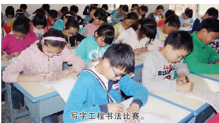
写字工程书法比赛。