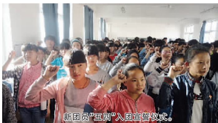
新团员“五四”入团宣誓仪式。

作为校园文化建设中的一部分，该校的班级文化建设也呈现出一道道亮丽的风景。班级文化建设凸显小组建设，营造了“一班一特色、一班一精彩”的文化氛围。各班自行设计的有学习园地、图书角、班级荣誉角、小组展示台等，以生动活泼的形式、积极健康的内容润物无声地影响着每一个人，培养着学生的思想境界和审美能力。