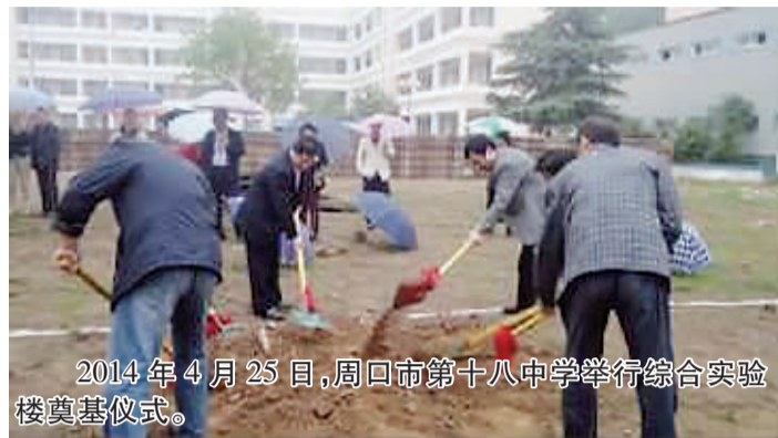
2014年4月25日，周口市第十八中学举行综合楼奠基仪式。