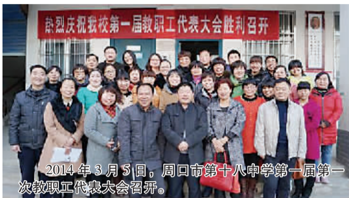
2014年3月5日，周口市第十八中学第一届第一次教职工代表大会召开。