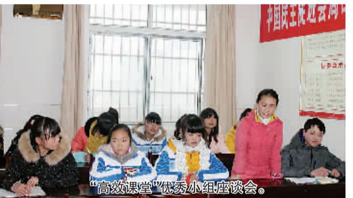
“高效课堂”优秀小组座谈会。