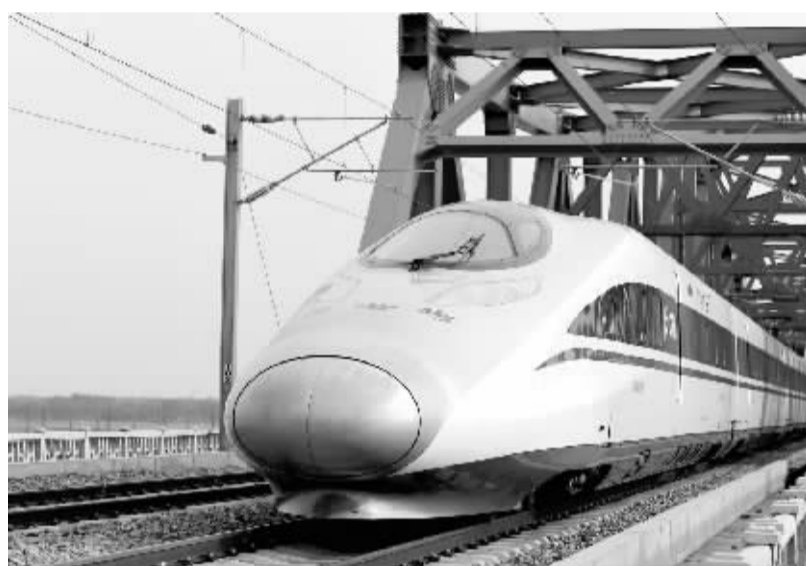
郑焦铁路正式进入运行试验阶段 5月4日,一列动车组列车驶过郑焦铁路途间的铁路黄河大桥。当日,郑(州)焦(作)铁路经过近一个月的联调联试后,正式进入开通运营前的“高速铁路运行试验”阶段,计划试验速度为200km/h。

据了解,部分第三方网站对12306网站向旅客提示的信息进行了屏蔽或显示不全,可能会对旅客购票乘车造成不便。铁路部门提醒广大旅客使用12306官方网站购票。