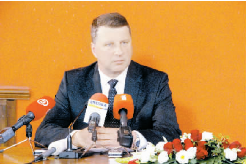
韦约尼斯当选拉脱维亚总统 6月3日，在拉脱维亚里加的议会大厦，韦约尼斯当选后向媒体发表讲话。拉脱维亚现任国防部长韦约尼斯3日当选拉脱维亚新一届总统。

去年11月29日，开罗刑事法院对穆巴拉克所涉多起案件作出无罪判决，其中包括穆巴拉克、阿德利及其6名助手谋杀示威者案和穆巴拉克及其两个儿子低价向以色列出口天然气牟利案。此后，挪用公款成为穆巴拉克背负的唯一罪名。