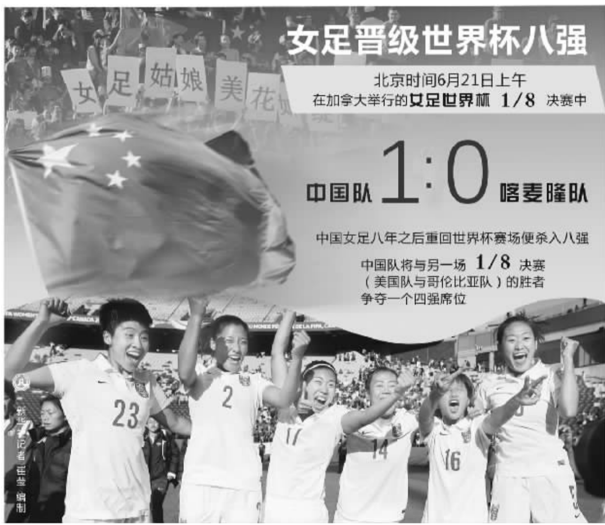
女足晋级世界杯八强 北京时间6月21日上午 在加拿大举行的女足世界杯 1/8 决赛中 中国队 1:0 喀麦隆队 中国女足八年之后重回世界杯赛场便杀入八强 中国队将与另一场 1/8 决赛 (美国队与哥伦比亚队)的胜者 争夺一个四强席位