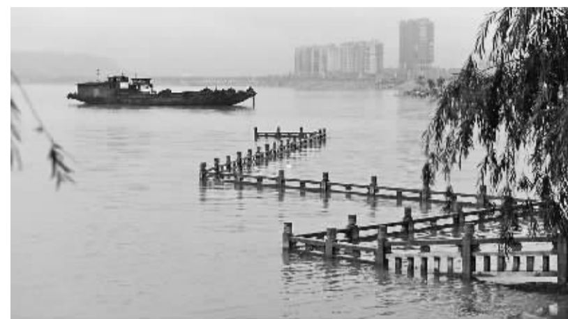
鄱阳湖水位超警戒线 6月22日,位于星子县城的鄱阳湖观景台已被湖水淹没。受新一轮强降雨影响,江西鄱阳湖水持续上涨,截至当日14时,鄱阳湖星子站水位为19.34米,超过警戒水位0.34米,为近3年来最高水位。由于湖水持续上涨,江西省星子县6431亩农田受淹,防洪压力加大。

端午假期,出游家庭多选择山水田园类景区和“乡村游”等老少皆宜的休闲景区点,采摘西瓜、荔枝、杨梅等时令水果,品尝有机农家菜,全家团聚,其乐融融。广州长隆、欢乐谷等景区人气爆棚。尽管端午节不在高速公路免费通行范围之内,不少家庭依旧选择便捷的自驾游。在气温较高的南方,不少结束高考的学生和青年白领选择漂流等水上游乐项目减压。