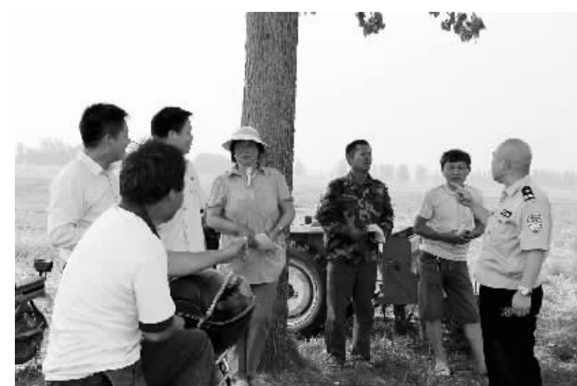
近日,扶沟县人民法院法官深入田间地头,采取悬挂横幅、发放《环境保护法》宣传资料等形式,现场为农民讲解秸秆焚烧的危害和综合利用的益处、方法,努力实现农民增收与环境保护的双赢。