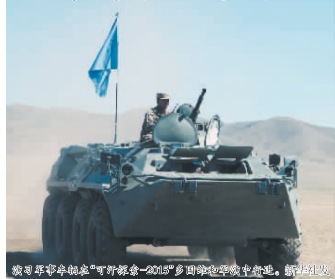
演习军事车辆在“可汗探索-2015”多国维和军演中行驶。