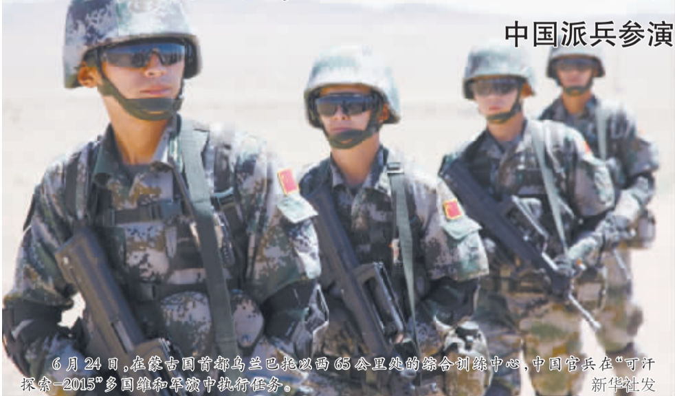
6月24日,在蒙古国首都乌兰巴托以西65公里处的综合训练中心,中国官兵在“可汗探索-2015”多国维和军演中执行任务。