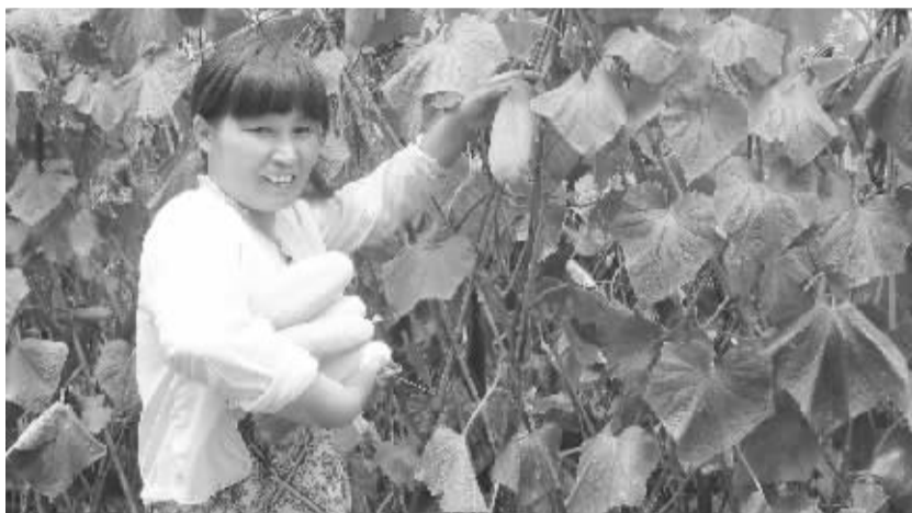
昨日,商水县平店乡赵庄村生态农业基地一名妇女正在采摘优质无公害黄瓜。该县千方百计引导农民对空闲地、低洼地、贫瘠地进行开发改造,大力发展现代生态农业,农业生产实现了生态化、科学化、常态化。

“五河”共治行动还感动了鹿邑籍在外工作的各界人士,他们纷纷捐款表示拥护和支持。著名传记作家陈延一听说家乡正在开展“五河”共治,寄诗称赞。鹿邑网友向全县各界发出“五河”共治倡议书。环卫工人不辞劳苦,运走拆迁后留下的一堆又一堆垃圾。全县团结一致开展“五河”共治的行动,处处传递着正能量,广大干部群众以不尚空谈的实干精神诠释着鹿邑走向美好明天的旅程。