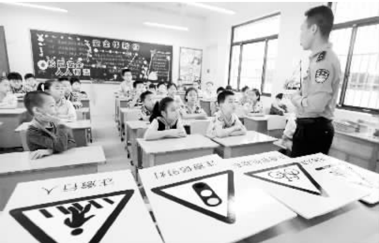
暑假安全“课” 7月9日,一名交警在江苏省苏州市东大街小学为学生讲解交通安全知识。当日,江苏省苏州市东大街小学举行“小学生暑期安全”主题活动,来自姑苏区交警大队七中队的交警向学生普及道路交通安全常识,加强学生们安全出行的意识。 新华社发

陈昌智指出,做好今天的爱国拥军工作,积极推进这项事业的发展,为新时期国防和军队建设贡献力量,是对抗战胜利的一种很好的纪念。要弘扬民族大义,把爱国拥军的旗帜举得更高;凝聚民族力量,把爱国拥军的基础打得更牢;依靠奋斗精神,把爱国拥军的事业做得更好。