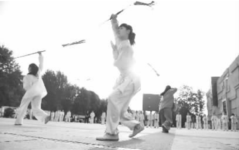
推广武术 全民健身 7月10日,几名武术爱好者在固安县人民广场上练习八卦剑。河北省固安县于2013年5月成立“方城武术研究会太极拳推广中心”,致力于公益传播太极拳法等武术项目,推动全民健身运动。

杨文庄指出,单独两孩政策的目标人群大多数生活在城镇,生育行为受住房、教育、年龄等因素的影响和制约,表现为再生育的行为更加理性、更加谨慎,因此在生育政策调整完善的同时,应当研究制定与之相配套的经济、社会和家庭发展的政策,解除群众的后顾之忧,使生育政策能够更好地发挥作用。