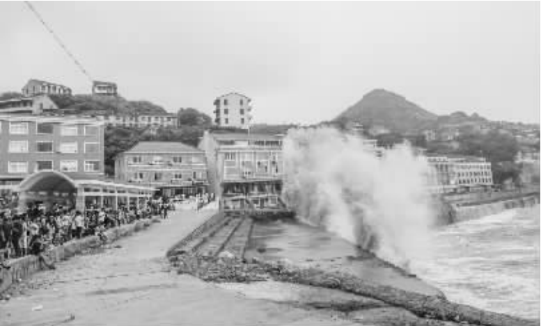
超强台风“灿鸿”逼近浙江 7月10日,温岭市三春村的海塘内掀起巨浪。随着超强台风“灿鸿”的靠近,浙江海域出现大风大浪。10日10时,浙江省海洋监测预报中心发布海浪Ⅰ级红色警报和风暴潮Ⅱ级橙色警报,浙江沿海温州、台州、宁波、舟山等地2万多艘渔船已进港避风。