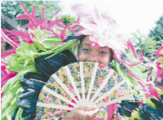
缤纷的青少年加勒比狂欢游行 7月18日,在加拿大多伦多,身着盛装的女孩在游行中进行展示。当日,上千名身着盛装的青少年用造型各异的花车及五彩缤纷的服饰,为人们展现了充满青春活力的加勒比风情。