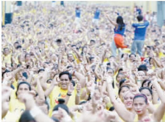
万人齐跳尊巴舞 7月19日,在菲律宾曼达卢永市,爱好者共舞尊巴。当日,12975名爱好者齐聚曼达卢永市共跳尊巴健身舞,刷新了吉尼斯世界纪录。