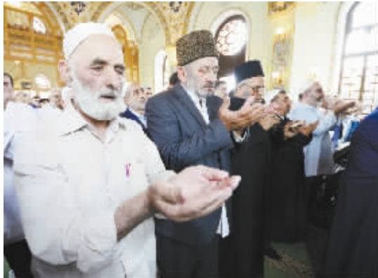
阿塞拜疆穆斯林迎来开斋节 7月18日,在阿塞拜疆首都巴库的塔扎皮大清真寺,当地穆斯林进行开斋节聚礼。当日,阿塞拜疆穆斯林结束斋月,迎来开斋节。