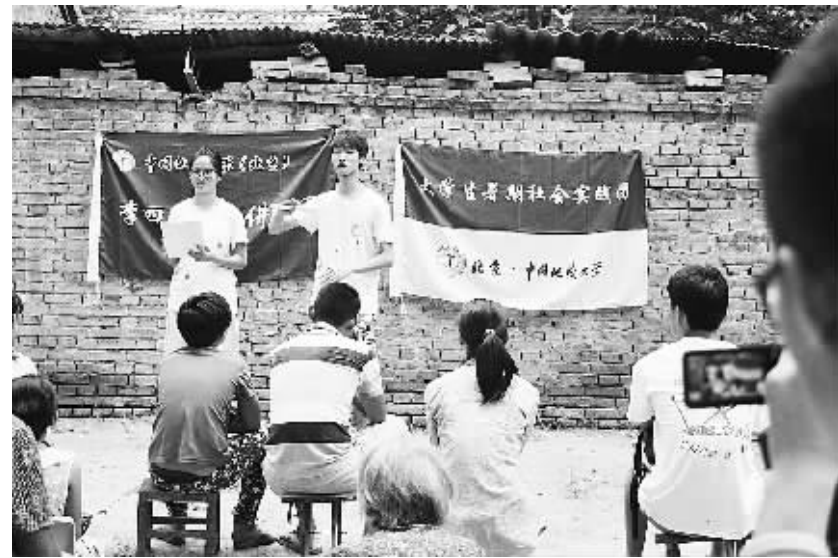
7月28日,中国地质大学(北京)“寻访新农梦,我们在路上——赴淮阳‘三农’之旅”实践团抵达淮阳县进行社会实践活动。实践团一行深入农户,针对农村建设、农业生产和农民生活等相关问题进行问卷调查,取得了良好的效果。