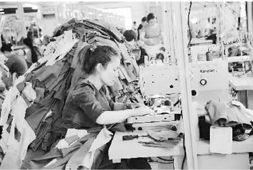
项城市以产业集聚区为平台,全力推进台资引进工作,促进了地方经济的快速发展。图为7月28日该市某台资企业车间内的工人正在紧张作业。

当天上午,督查考核组按照既定路线,先后对市交警支队六个大队所辖路段的交通秩序管理维护情况,重点部位、路段警力部署和管理情况以及“四区”市容市貌、环境卫生清扫保洁、路面清扫情况、文明社区创建等工作进行督