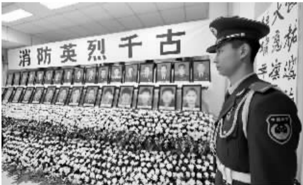
8月17日,在天津市公安消防局开发支队临时灵堂内,一名消防战士站在消防英烈的照片前。