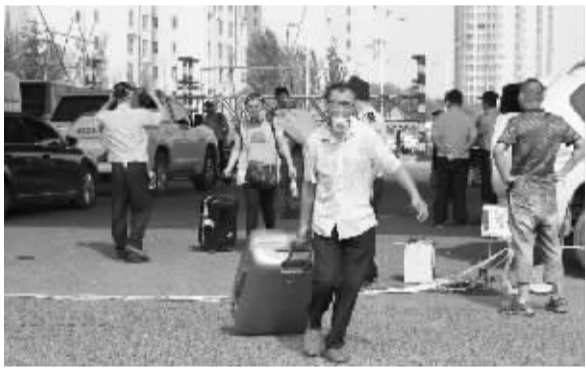
8月17日,居住在天津万科海港城的居民在当地民警、武警和政府工作人员的陪同下返回家中取出物品。