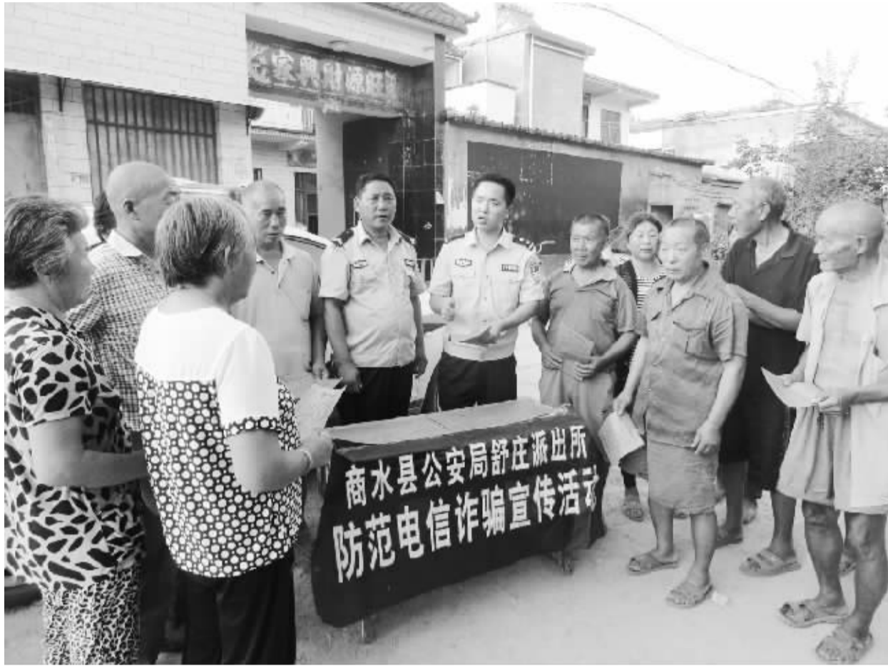
昨日,商水县舒庄派出所民警在邮政储蓄所门前开展防范电信诈骗宣传活动。针对当前农村电信诈骗猖獗,舒庄派出所组织全所民警深入农村信用社、邮政储蓄所、集市、街头、村庄开展防范电信诈骗宣传活动,通过发放宣传资料、剖析电信诈骗手法、讲解预防电信诈骗方法、介绍当地电信诈骗案例等形式,教育群众谨防上当受骗,确保财产安全。

体验活动结束后,网友们纷纷表示,周口公安工作辛苦繁重,公安民警确实实实在为百姓做事、全心全意为人民服务。今后,将多关注周口公安工作,积极为周口公安提供正能量,通过手中的镜头和网络,用自己的力量和所见所闻,让更多的群众了解公安、理解公安、支持公安,弘扬周口公安正能量,为平安周口建设贡献自己的力量。