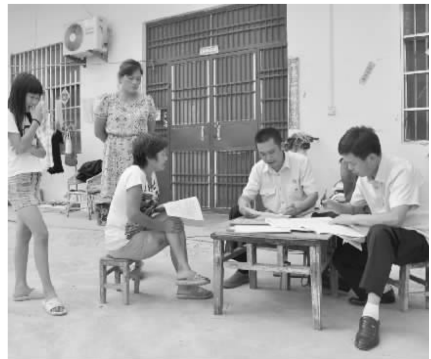
太康县法院切实从人民群众的需求出发,加大案件调解和巡回审判力度,积极深入田间地头、农家庭院、案发地及时为群众化解矛盾纠纷,真正把“三严三实”要求落实到法院实际工作中。图为8月13日该院法官来到城郊乡大于村一当事人家中做调解工作。(李康摄)

在帮扶过程中,共发现和梳理出涉及岗位人员管理考核、违章作业、检修作业现场勘察、临时用电管理等方面的问题13项,并及时进行了整改销号,使被帮扶供电所存在的薄弱环节和问题得到了有效解决。(郑志强)