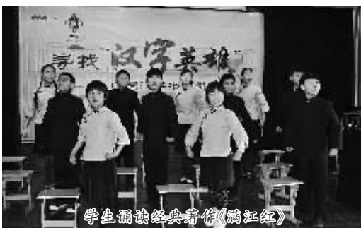
學生閱讀經典著作(滿江紅)