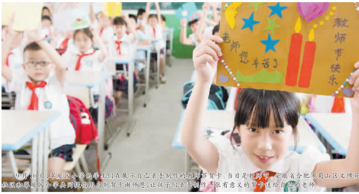
9月10日,翠庭园小学的学生们在展示自己亲手制作的教师节贺卡。当日是教师节,安徽省合肥市蜀山区文博苑社区翠庭园小学共同提倡自制贺卡谢师恩,让孩子们亲手制作一张有意义的贺卡送给自己的老师。

坚守海岛26载的福建莆田小学教师魏亚建等10名“全国师德楷模”近日在北京接受了教育部等部门的表彰。在全国第三十一个教师节前夕,这些来自教育一线,尤其是偏远农村教育一线的教师,用他们的平凡和坚守,赢得全社会的尊重,绽放出人生的光彩,点亮教师职业的光荣。