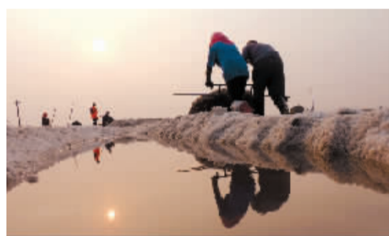
淮盐丰收迎“秋扒” 9月10日,连云港台北盐场工人在进行扒盐作业。当日起,江苏连云港境内50万亩原盐全面进入“秋扒”作业,工人们加紧收获原盐。