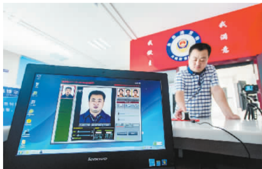
山西洪洞推行居民身份证照片自拍系统 9月14日,市民在山西省洪洞县大槐树派出所录入身份信息。近日,山西省洪洞县大槐树派出所推出居民身份证照片“自助满意拍”系统,市民可以在拍摄区进行自助拍摄。