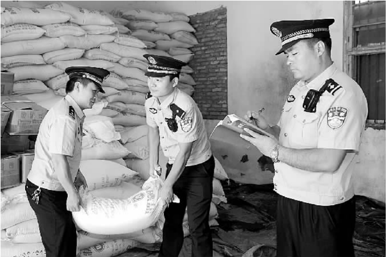
日前,扶沟县公安局城关派出所经过一个月的侦查,与该县盐业局一起捣毁3个储售假盐窝点,查获假盐10余吨,抓获嫌疑人5名,其中刑事拘留2人。经河南省盐产品质量监督检验中心鉴定,该批次食盐属于不合格产品。日前,此案正进一步侦办中。图为该县民警在登记查获的假盐。

中州路一家月饼专柜的促销员王女士介绍,今年各厂家虽然也准备了中高端月饼产品,但都不是主打产品,主要还是为了平衡“产品线”和“品牌形象”。现在主推的还是平价月饼,小包装月饼口味现有24种,每块月饼的价格都在10元以下,市民都很乐意购买。