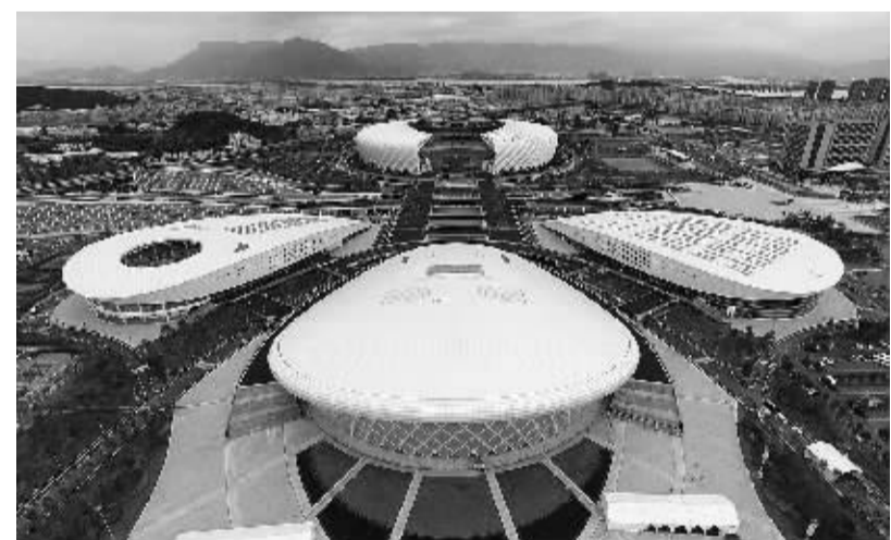
空中看场馆 这是10月9日拍摄的第一届全国青年运动会主会场——福州市海峡奥体中心。第一届全国青年运动会开幕式将于2015年10月18日在福州市海峡奥体中心主体育场举行。

据通报,丽江古城景区游客宰客情况严重,商户存在欺客行为,餐饮场所等价格虚高,多数商铺无明码标价。明十三陵景区外围欺客宰客现象严重,无明码标价,计量不准确。佛山市西樵山景区交通组织管理不力,外部交通衔接缺失,内部人车混行,卫生管理较差。南通市濠河景区、杭州市西溪湿地旅游区、上海市东方明珠广播电视塔主要存在安全隐患明显等问题。