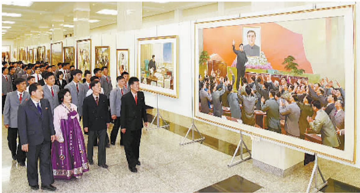
朝中社10月5日提供的照片显示,庆祝朝鲜劳动党建党70周年国家美术展览会在平壤体育馆开幕。新华社发

在工业生产领域,朝鲜确立了朝鲜式经济管理方法,各工厂、企业按照客观经济规律和现代科技要求进行生产和管理,生产效益明显提高,不少企业职工的工资成倍增长,购买力增强。朝鲜还努力提高国产化率,注重发展本国产业。走进平壤的大型购物中心,会发现朝鲜本国商品比例逐年增加。