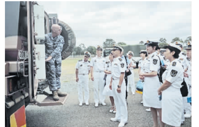
中国海军和平方舟医院船官兵与澳方同行开展专业交流

国际货币基金组织和世界银行秋季年会正式会议于10月9日至11日在利马召开,与会的各国财政部长和央行行长们将就全球经济增长前景、宏观经济政策协调、应对气候变化等议题展开探讨。