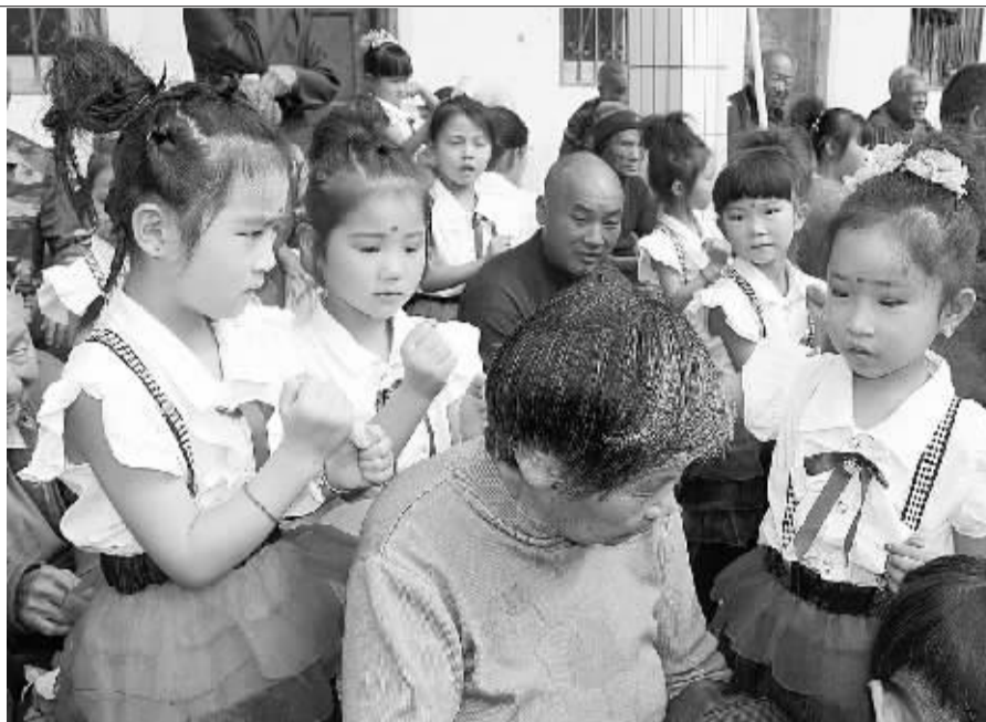
重阳节将至,为培养孩子尊老、爱老、敬老的品质,让孩子拥有一颗感恩的心,10月19日,扶沟县吕潭镇尚村幼儿园全体教师生到敬老院和爷爷奶奶们进行联欢活动,加深了老少之间的情感,也让孩子们和老人们体验到了共同庆祝重阳节的快乐。