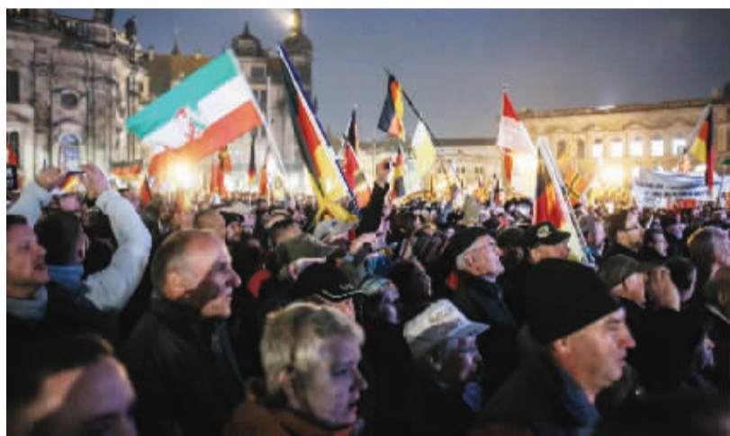
德国东部发生大规模排外示威 10月19日,在德国东部城市德累斯顿,示威者手举旗帜参加游行。德国东部城市德累斯顿19日晚发生大规模排外示威,反对大量难民涌入。当晚参加排外示威和反排外游行团体人员总数或超过3万人。排外者认为,难民到来会扰乱就业市场,还会带来文化上巨大冲击。反排外者则试图传递另一种声音,守卫德国“欢迎文化”。