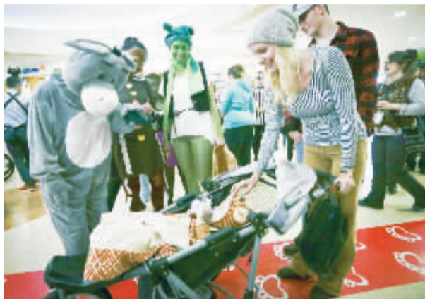
儿童医院为孩子们举行万圣节活动

“罗纳德·里根”号航母是美国尼米兹级核动力航母,2003年开始服役,隶属美国太平洋舰队,今年10月1日抵达日本横须贺的美国海军基地,轮换“乔治·华盛顿”号航母。