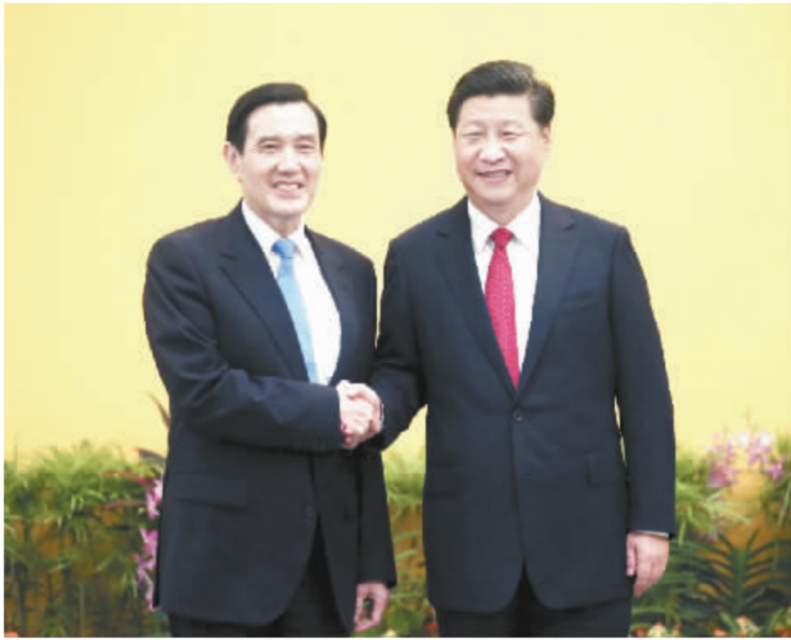
11月7日,两岸领导人会在新加坡香格里拉大酒店举行。这是习近平同马英九握手。

两岸关系发展历程告诉我们,台海动荡紧张,两岸冲突对抗,民众深受其害;走和平发展之路,谋互利双赢之道,利在两岸当下,功在民族千秋。两岸同胞应该倍加珍惜和平发展成果,彻底化解