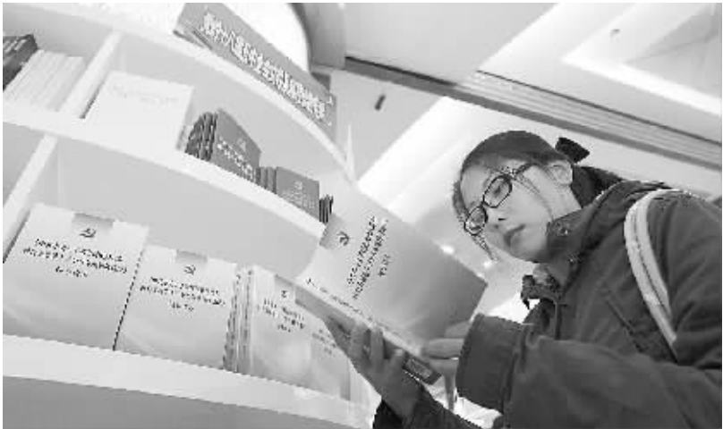
11 月 9 日，一名读者在北京图书大厦“党的十八届五中全会文件及辅导读物专架”前阅读。当日，党的十八