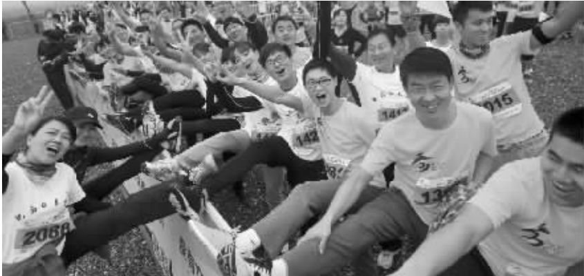
11 月 22 日,参加选手在赛前热身合影。当日,2015 中国·合肥(大圩)马拉松赛开幕。该赛事共设三个项目,参赛规模达 5000 人。