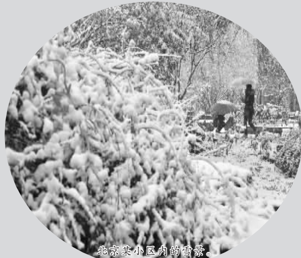
北京某小区内的雪景。