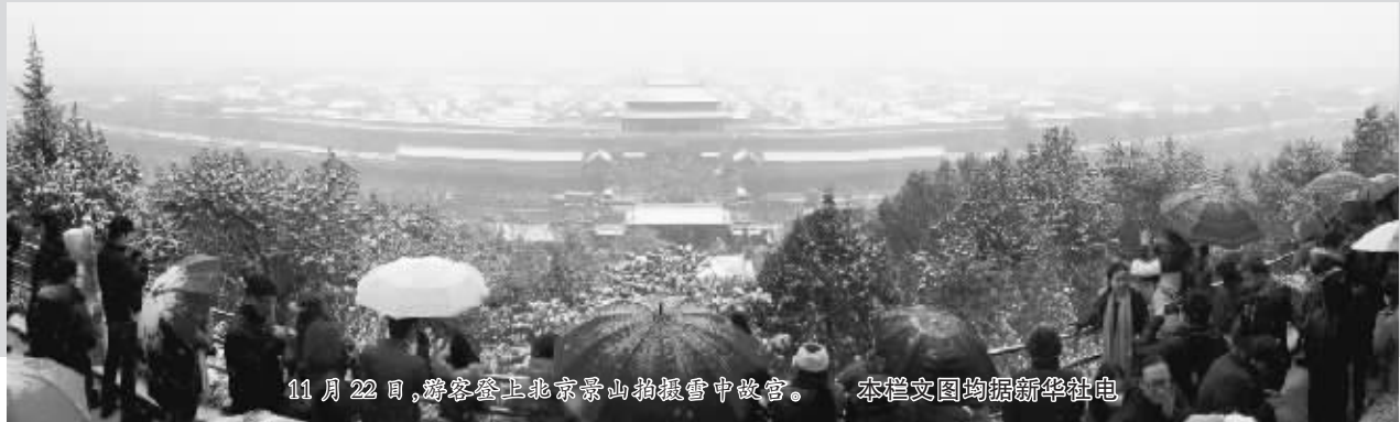
11 月 22 日,游客登上北京景山拍摄雪中故宫。