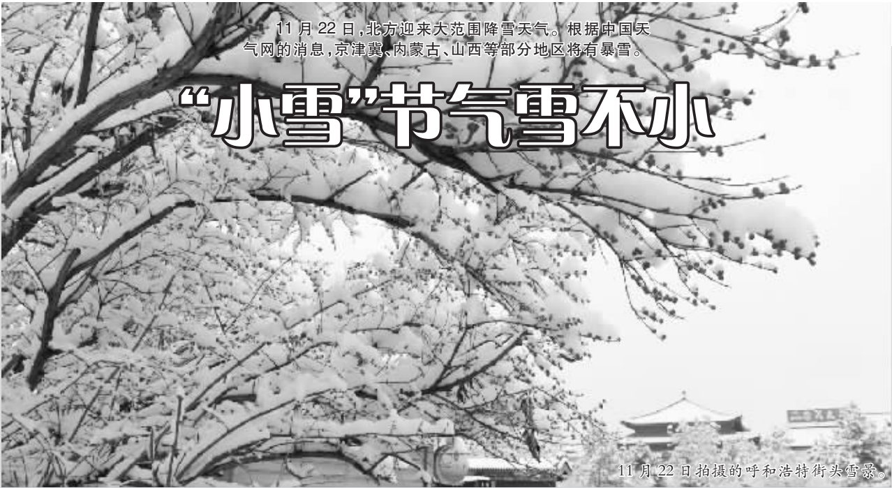
11 月 22 日,北方迎来大范围降雪天气。根据中国天气网的消息,京津冀、内蒙古、山西等部分地区将有暴雪。