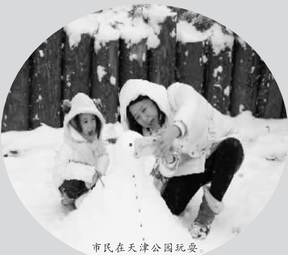
市民在天津公园玩耍。