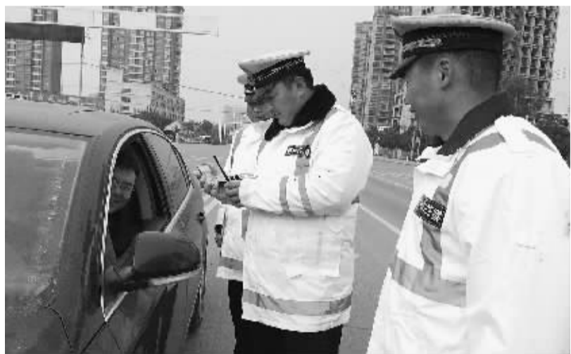
近日,扶沟县公安局交警大队在全县范围内集中查处超速、超载、酒驾、毒驾等违法行为,在县城重点路段增派民警,加强宣传提示,带动社会各界共同关注交通安全问题。

通过“一村一警”工作的推进,辖区群众安全感迅速提高,全镇信访、治安、刑事等案件发生率明显下降。