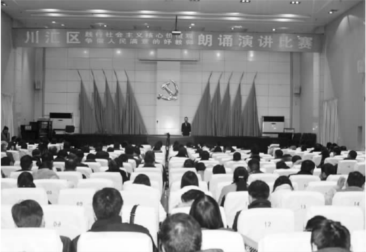
为进一步培育和践行社会主义核心价值观,推动核心价值观内化于心、外化于行,1月19日上午,川汇区委宣传部、川汇区教体局在区政府综合大楼中心会议室联合举行“践行核心价值观 争做人民满意的好教师”朗诵演讲比赛。区教体局机关全体工作人员以及川汇区教育系统近400名教职工聆听了演讲。

本报讯 为培养学生良好的读书习惯,激发阅读兴趣,在全校形成人人爱读书、读好书的书香氛围,近日,周口市七一路二小开展了班级课外阅读交流活动,全校到处弥漫着书香气息。据了解,为培养学生养成良好的读书习惯,营造浓郁的校园读书氛围和书香育人环境,七一路二小把“扎实做、坚持做”作为激励每个教学班的读书信条,在全校组织开展了“晨诵午读”“班级读书会”“读书沙龙”“共读一本书”等读书活动。(张雅莉 王瑞丽)