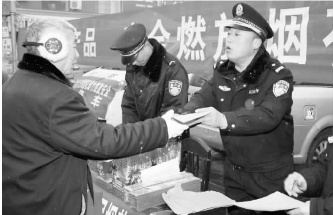
1月24日,扶沟县公安局民警冒着严寒在街头向过往群众发放烟花爆竹安全燃放知识资料。近日,该局组织民警走上街头、走进社区,开展以“购买合格产品,安全燃放烟花爆竹”为主题的宣传活动,为预防和减少春节期间燃放烟花爆竹事故的发生营造舆论氛围。

本报讯 (记者 徐如景 通讯员 杜鑫) 近日,沈丘县人民法院青年志愿者走上街头,冒着严寒,配合交警在行政新区繁华路口开展“文明交通伴你行”社会公益活动,成为该县一道靓丽的风景线。“大爷,红灯亮了,请稍等”“同志,请您不要走机动车道,注意安全”……1月21日早晨,该院13名青年志愿者在城区路口言辞恳切地提醒过往行人遵守交通规则,文明礼貌出行。他们头戴小红帽,分驻在四个路口和公交车停靠站牌处,热心提醒行人,引导车辆文明出行,并对行人闯红灯和乱穿马路等影响市容环境秩序和不文明的交通行为进行制止和劝导,宣传交通法规知识,协助交警指挥疏导交通。十字路口人流量多,有些行人无视红灯冲向道路中间,有的人骑着电动车在机动车道上行驶,还有的人骑着自行车和机动车抢道,看到这些,青年志愿者都会走上前耐心劝导和制止,劝导行人注意出行安全、树立文明交通意识,确保道路交通安全、有序、畅通。该院不断提高青年志愿者的实践能力,培养关爱他人、回报社会的美好情操,增强青年干警的团队意识和奉献精神。截至目前,该院青年志愿者已开展各种社会公益、献爱心活动20余次,引导带动公共单位、居民从自身做起、从小事做起,以实际行动参与到各项工作中来,受到了群众的广泛好评。