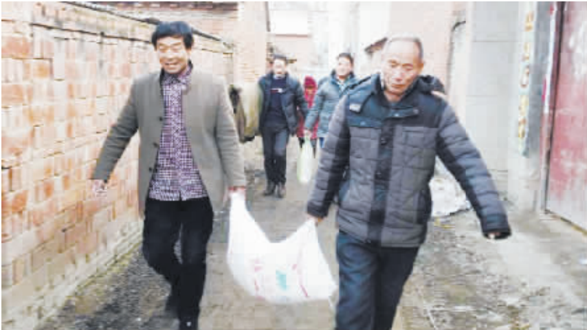
2月2日上午,李寨镇人力资源和社会保障所走访慰问了大范行政村的困难家庭,为他们送去了大米、花生油等慰问品和慰问金。