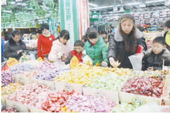
春节临近,项城市区各大超市,弥漫着浓浓年味儿,众多市民前往超市购置年货。