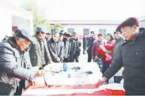
日前,贾岭镇组织书法家到苏阁村又写春联,为当地群众提前送去一份新年祝福。