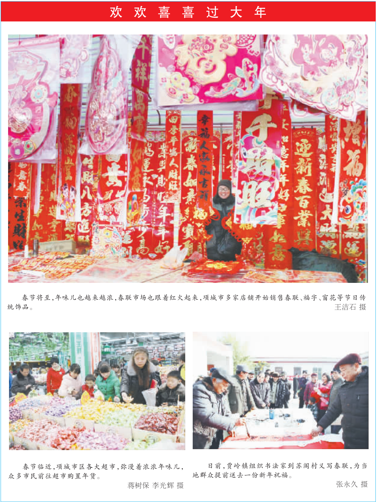
春节将至,年味儿也越来越浓,春联市场也跟着红火起来,项城市多家店铺开始销售春联、福字、窗花等节日传统饰品。

附近市民休闲娱乐的好去处。同时,围绕民生问题,项城市还实施了自来水改造以及学校、医院、中心广场、新型农村社区建设等基础设施项目,总投资160亿元,新建了湖滨路、南环路、天安大道等城市主干道。同时,在城南新区建设欧蓓莎国际商城等一批与人民群众息息相关的民生工程,在提升城市品位、拉动经济增长的同时,大力改善群众生活。 “2015年,项城市社会保险参保人数达108.5万人次,发放各类社会保险金6.47亿元。城镇新增就业8866人,完成目标任务的130%。新农合参合率达99.7%,补偿金额3.7亿元。发放城乡低保金、五保供养金、优待金、大病医疗救助金1.3亿元,真正让广大群众得到了实惠。”项城市长刘昌宇说。 全国文化先进市、全国绿化先进市、中国最具发展潜力城市、千年古县、河南省文明城市等桂冠相继花落项城,让项城在和谐宜居的同时,充满激情,魅力无限。