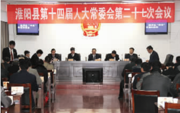
市人大常委会开展对部分法官、检察官述职评议

扎实开展“三严三实”专题教育。精心组织“严以律己”、“严以修身”、“严以用权”三个专题的集中学习研讨,常委会三位党组成员、副主任在县委理论中心组学习研讨时的发言得到了县委书记马明超的赞同。认真召开党组“三严三实”专题民主生活会,严格执行工作纪律和各项规定,常委会机关团结和谐,风清气正。 高度重视人大宣传工作。组织开展国家宪法日宣传教育,弘扬宪法精神,增强宪法意识。积极参与市人大常委会“铭记历史·珍爱和平暨庆祝建国66周年”书画作品展,被评为全市先进单位。开通人大手机报,建立人大常委会微信群,及时传达中央及上级精神,反映全县人大工作动态。加大宣传报道力度,淮阳县人大常委会被评为全省、全市人大宣传工作先进单位和市人大系统优秀调研成果先进单位、周口“环保世纪行”宣传工作先进单位。 切实加强党风廉政建设。认真学习中央八项规定和新修订的《中国共产党廉洁自律准则》、《中国共产党纪律处分条例》等党纪党规,严格执行习近平总书记提出的“五个必须”要求,任何时候任何情况下都在思想上政治上行动上同党中央保持高度一致。提出遵规守纪“十严禁”和廉洁自律“十不准”,对机关党员干部严格要求、严格教育、严格管理、严格监督,建设了一支讲规矩、守纪律、有激情、敢作为的人大干部队伍。