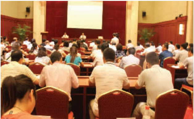
组织部派县人大代表到北京全国人大培训基地培训

常委会领导班子成员自觉服从县委的工作安排,全力做好包乡驻村、信访稳定、秸秆禁烧、平安建设等工作,深入联系乡镇指导工作,积极参与龙湖游乐园、新汽车站、辉华面业、教育路修建、垃圾填埋场二期工程等全县重点项目的推进及龙都朝祖会、龙湖环境治理、“两城一区”创建、“两违”整治、城区交通环境治理、企业改制、中小学教师招聘等中心工作,得到了县委的肯定。 组织开展“十三五”规划编制调研工作,向县委提交了6份专题调研报告,县委书记马明超批转县“十三五”规划编制