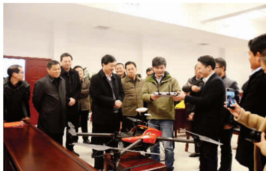
极飞科技无人机企业负责人向县领导讲解演示他们生产的无人机