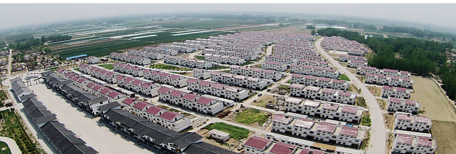
龙头头社区中心全貌