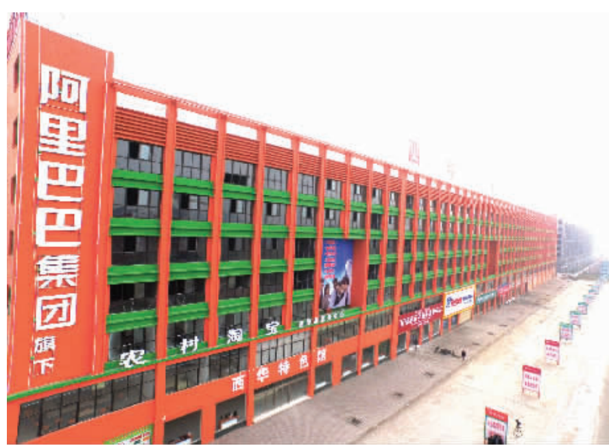
西华县电商产业园一角