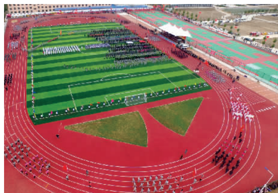
西华县首届运动会暨全民健身大会开幕式现场