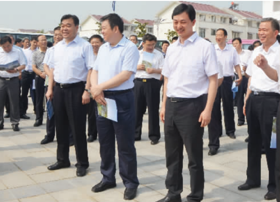
市委书记徐光、市长刘继标等市领导在县委书记林鸿嘉陪同下,带领市直有关部门和县市区主要负责同志到西华观摩指导扶贫开发工作