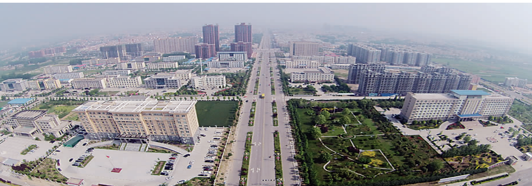
西华县行政新区展露新容颜