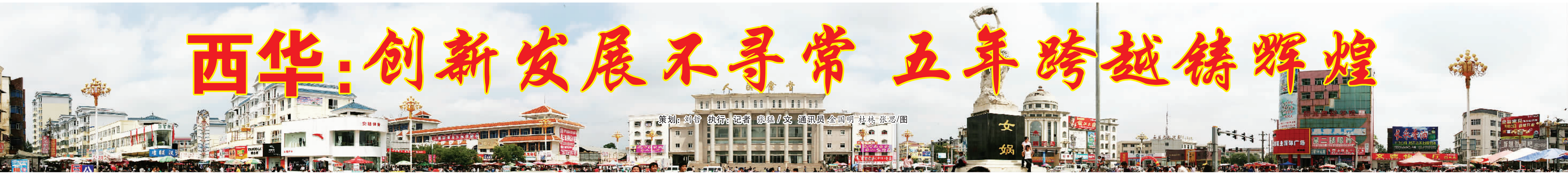
策划:刘哲 执行:记者 张猛/文 通讯员 全国明 杜林 张思/图