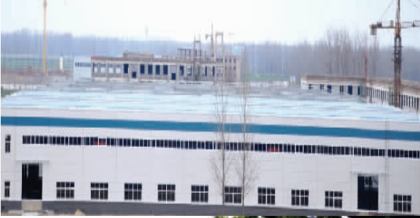
正在建设中的项目工地