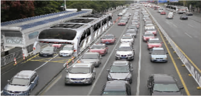
全球重大原创科技发明——立体巴士效果图