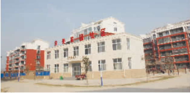
港区未来家园安置小区