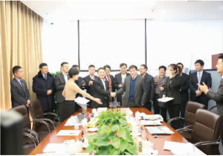
市长刘继标,市委常委、副市长刘国连在北京参加巴铁项目签约仪式