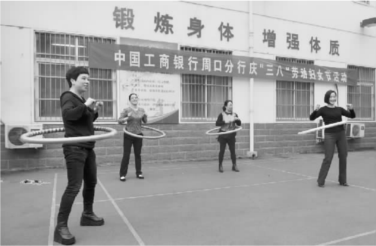
3 月 8 日，工行周口分行组织女职工开展跳绳、呼啦圈等趣味体育比赛，庆祝“三八”妇女节。

安民警应当牢记，当我们千里奔袭在抓捕犯罪嫌疑人征途上时，是妻子在勇当坚强后盾；当我们昼夜奋战在安保工作岗位上时，是妻子在勇挑家庭重担。同时也恳请广大警嫂，加强对丈夫的监督 and 提醒，帮助丈夫抵御各种诱惑和考验，坚决把腐败侵蚀和歪风邪气挡在门外。”