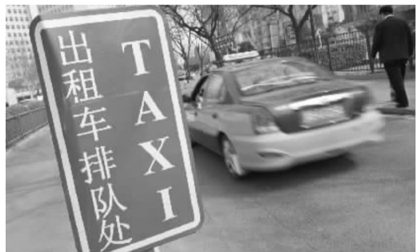
住建部、公安部废止《城市出租汽车管理办法》3月21日,出租车驶过北京一家饭店外的排队等候区。当日,住房城乡建设部官网发布消息,住建部、公安部已废止《城市出租汽车管理办法》。

中国载人航天工程办公室表示,目前天宫一号的飞行轨道仍在持续、密切的跟踪监视之中。根据预测,天宫一号的飞行轨道将在今后数月内逐步降低,并最终再入大气层烧毁。