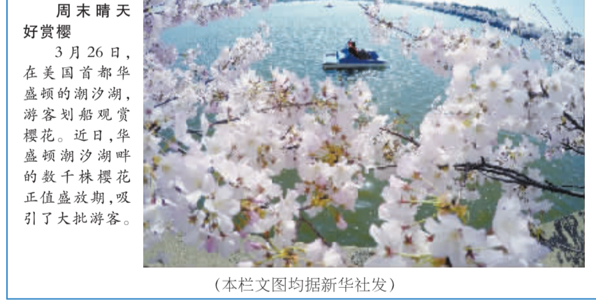
周末晴天好赏樱 3月26日,在美国首都华盛顿的潮汐湖,游客划船观赏樱花。近日,华盛顿潮汐湖畔的数千株樱花正值盛花期,吸引了大批游客。(本栏文图均据新华社发)