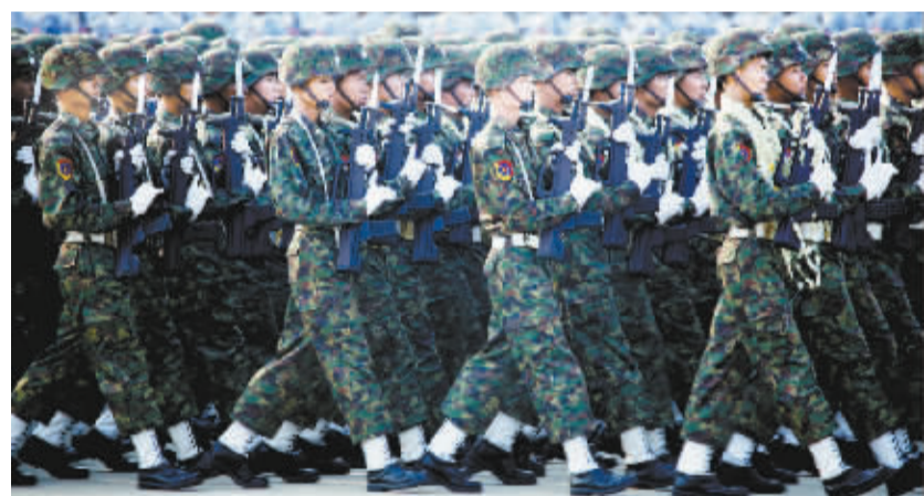
缅甸举行纪念建军71周年阅兵仪式 3月27日,在缅甸首都内比都,缅甸士兵参加阅兵仪式。当日,纪念缅甸建军71周年阅兵仪式在首都内比都举行。

谢里夫在发言时介绍了鲁哈尼访问期间两国达成的一系列合作成果。他说,两国就加强双边经贸、能源、金融等领域合作达成了多项协议,决定在未来5年内将双边贸易额由目前的10亿美元增至50亿美元。