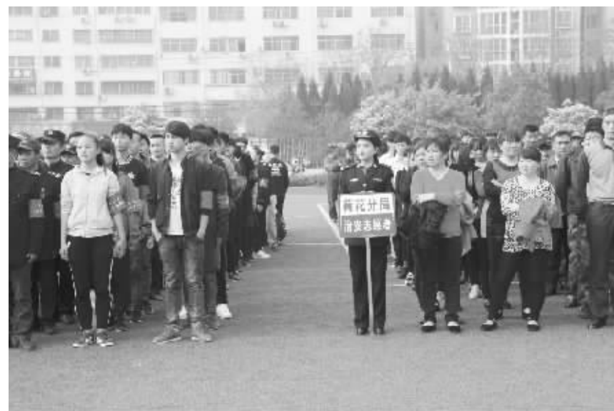
4月7日下午,在市公安局综合训练场上,1500多名志愿者戴上红袖章,参加治安志愿者誓师大会。据了解,市公安局以治安志愿者建设工作为抓手,全面梳理近年来治安志愿者队伍发展状况,分析信息员的物建、使用、管理等各个环节,大力推进治安志愿者组织化、社会化建设。