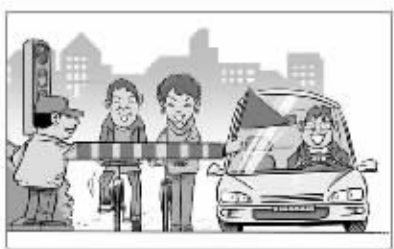
有公共文明引导志愿服务人员