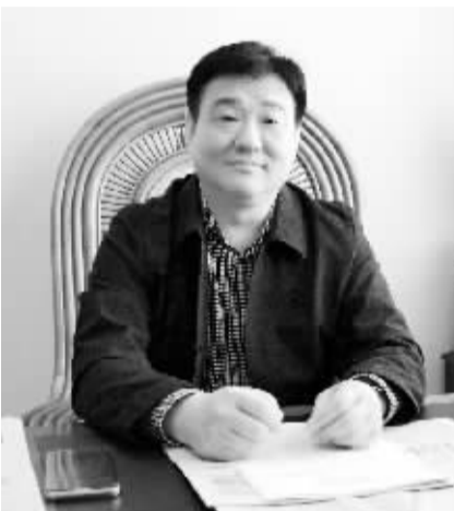
市体育局党组书记、局长 丁建清

余体育生活,为创建省级文明城市作出积极贡献。”昨日,市体育局党组书记、局长丁建清就周口市全民健身月、市三运会先期项目比赛启动仪式暨庆“五一”全民健身健步走活动,接受记者采访。