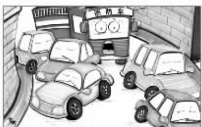
非机动车违章乱停现象