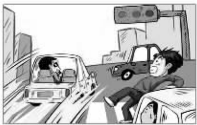
非机动车乱闯红灯、违章行驶现象