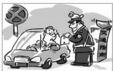
警容严整、坚守岗位、文明执法