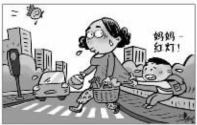
无行人乱闯红灯现象