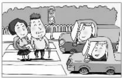
斑马线标线清晰完好