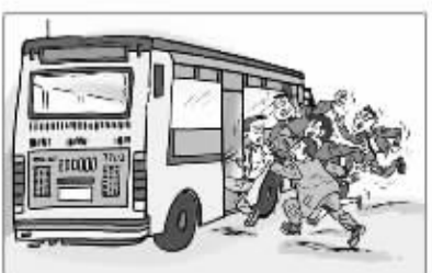
乘客遵守秩序,排队候车