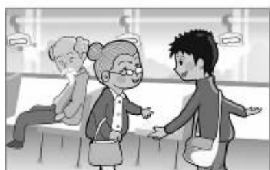
对老、弱、病、残、孕等人主动礼让